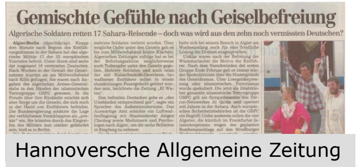
Hannoversche Allgemeine Zeitung