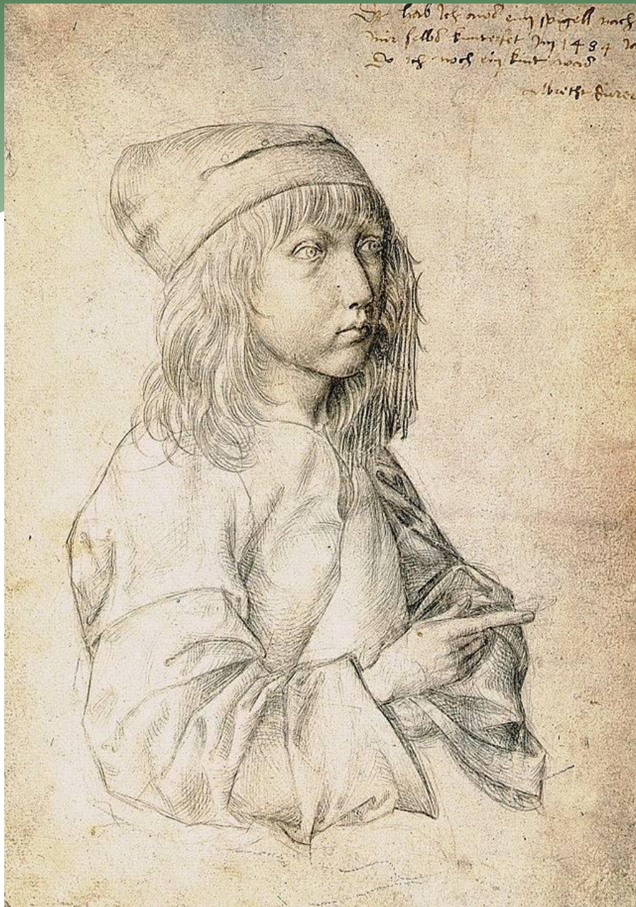
Автопортрет. Альбертина, 1484