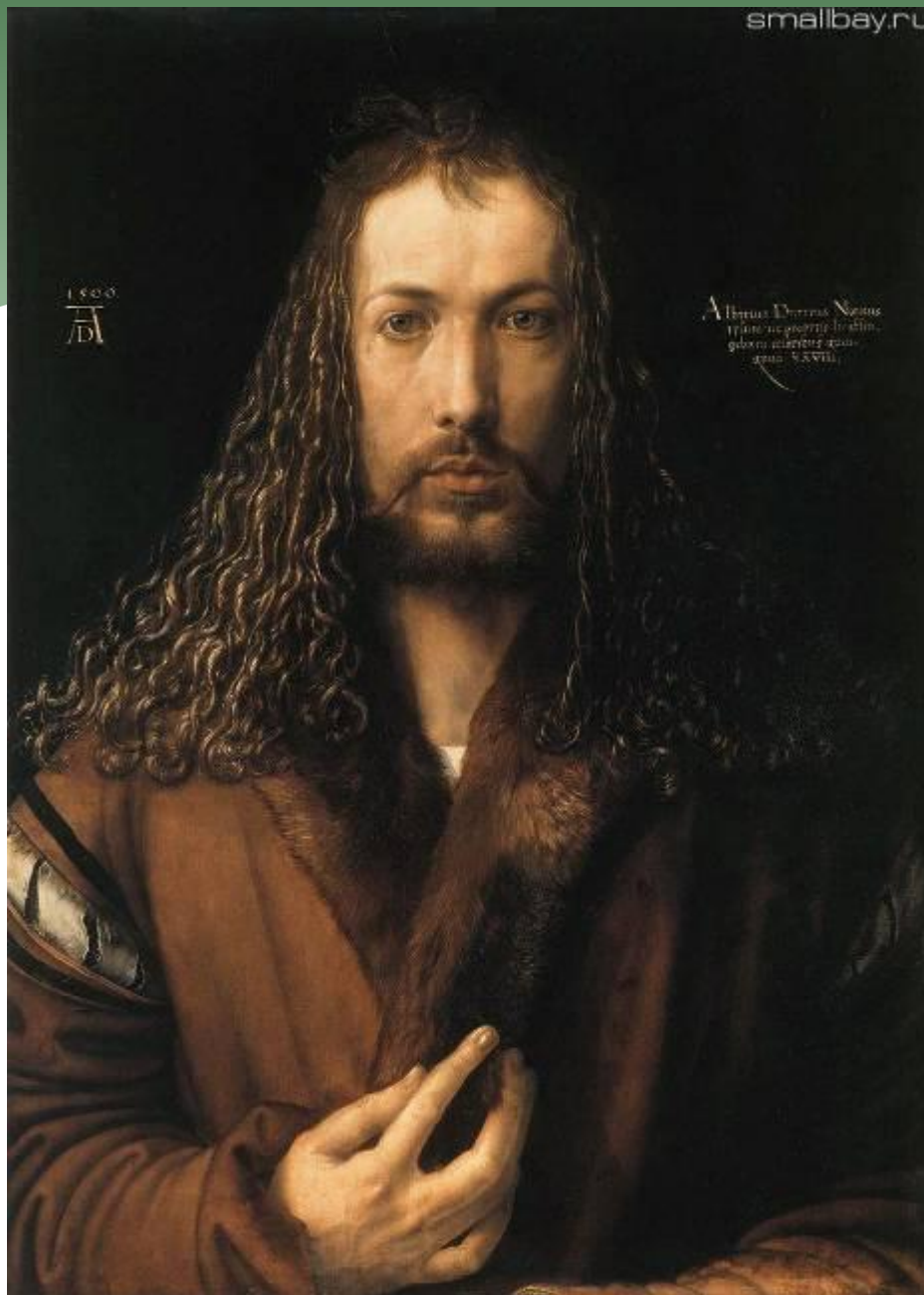
Автопортрет в зрелые годы 1500-е годы. Старая Пинакотека, Мюнхен.