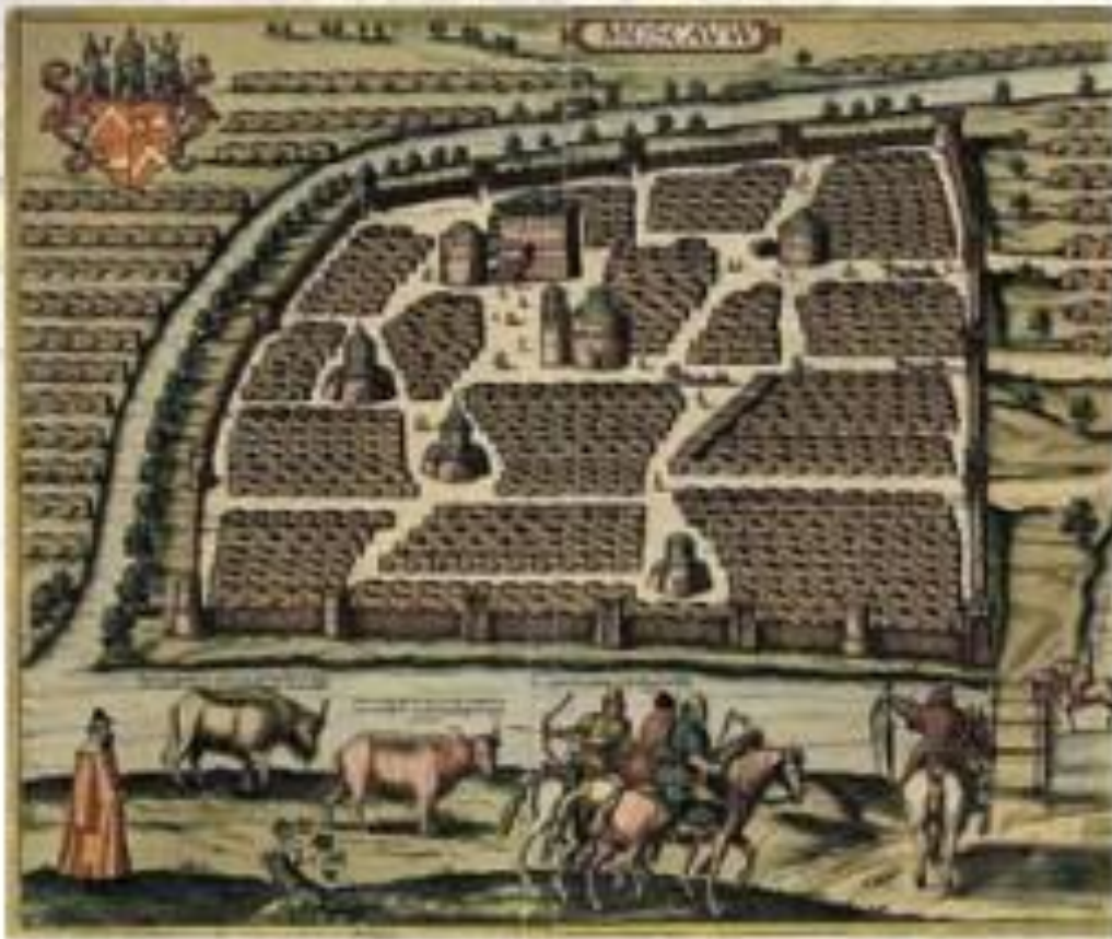
Карта Москвы XVI века