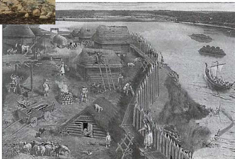
Поселение древних славян