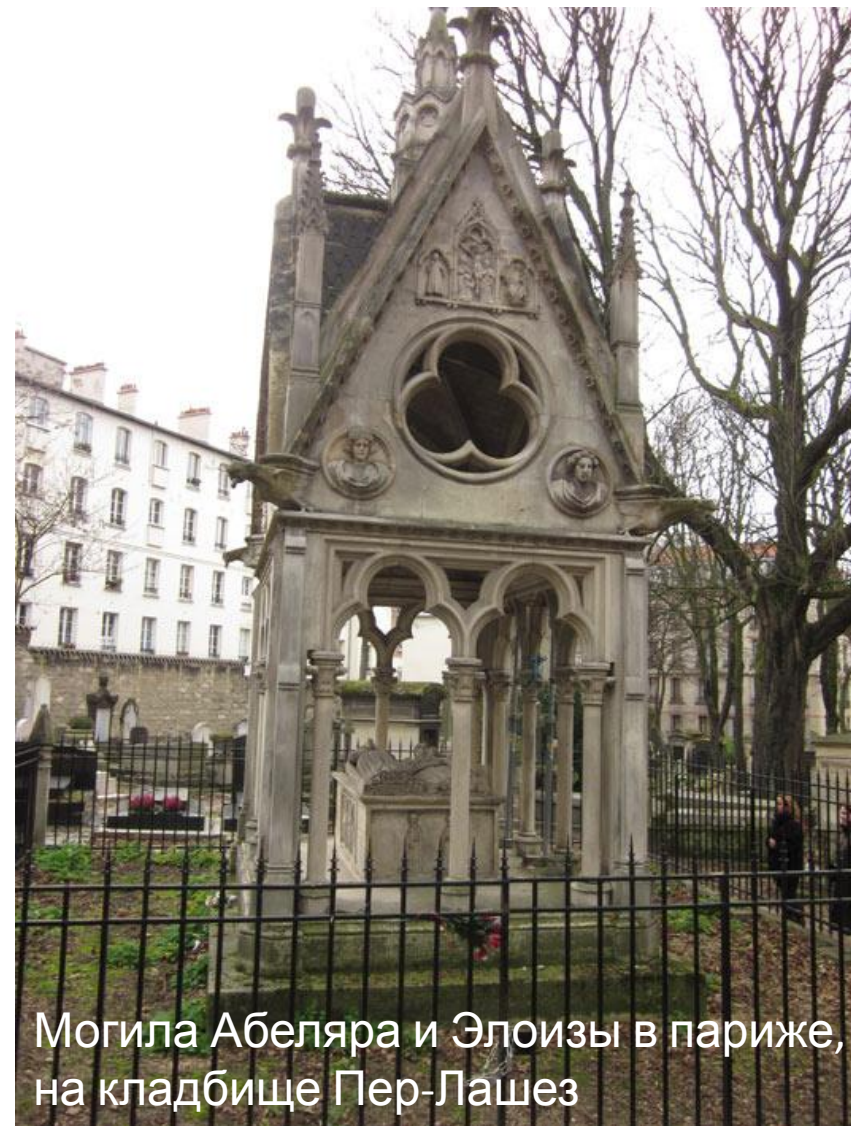
МогилА Абельяра и Элоизы в парижЕ, на кладбище Пер-Лашез

В 1142 г. здесь же, в Ключи, во время молитвы, Абельяр скончался. На его могиле, произнося эпитафию, друзья и единомышленники называли Абельяра "французским Сократом", "величайшим Платоном Запада", "современным Аристотелем". А через двадцать лет в этой же могиле, согласно ее последней воли, была похоронена и Элоиза, соединившись навеки после смерти с тем, с кем разлучила ее жизнь земная.