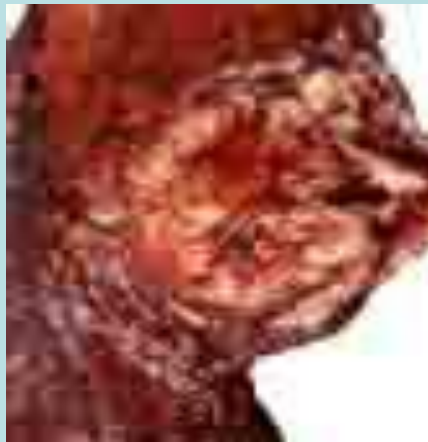
Легкие после 5 лет курения