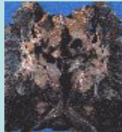
Легкие после 25 лет курения