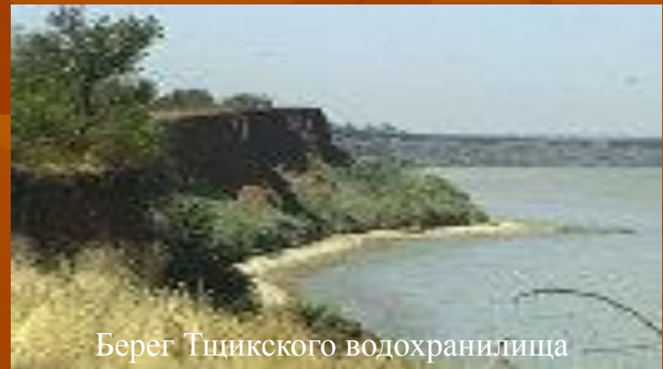
Берег Тщикского водохранилища