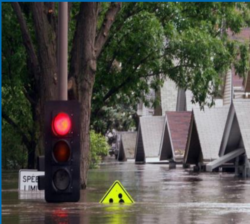
Цунами и наводнения