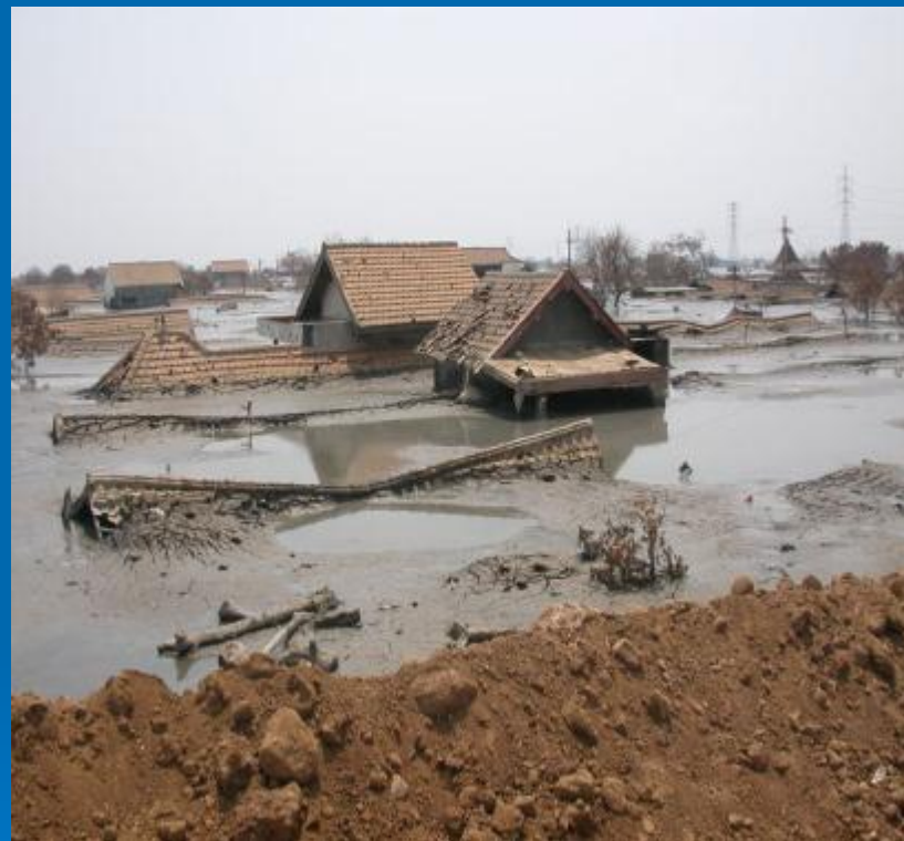
Сели – грязекаменные потоки