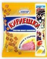
Ветчина с сыром