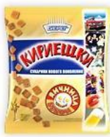
Яичница с беконом

В чипсах и сухариках содержание вредных добавок высоко. На этикетках многие добавки не указаны. Во всех образцах большое количество усилителей вкуса, которые вызывают кишечные расстройства E627, E631, E330 . Глутамат натрия E621 – вызывает повышение температуры тела, повышает артериальное давление, гиперактивизирует приток крови в доли головного мозга что способно привести к инсульту, вызывает носовое кровотечение.