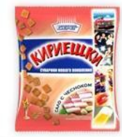
Сало с чесноком