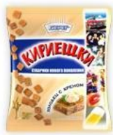
Холодец с хреном