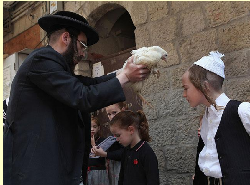
«Капарот» обряд искупления