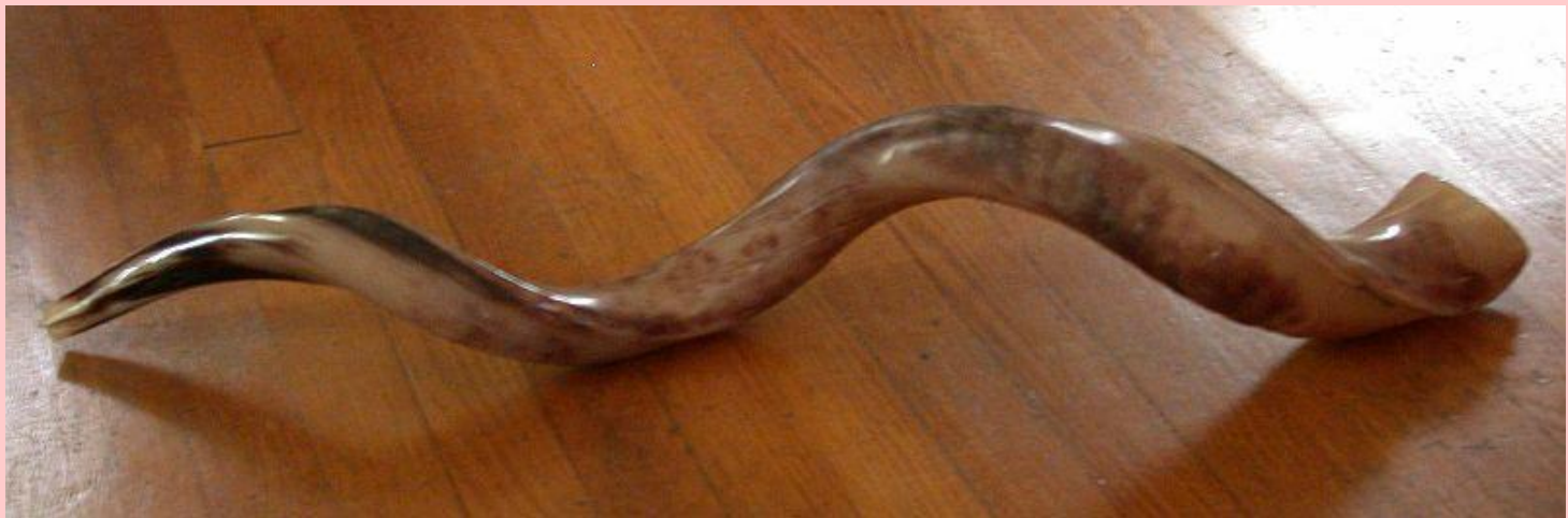
«Йеменский» шофар из рога антилопы куду