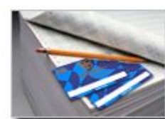
Руководителям региональных отделений и федераций