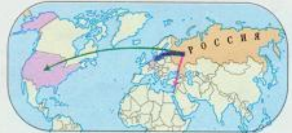
Выбывшие из России. 1990–2000 гг. (тыс. человек)