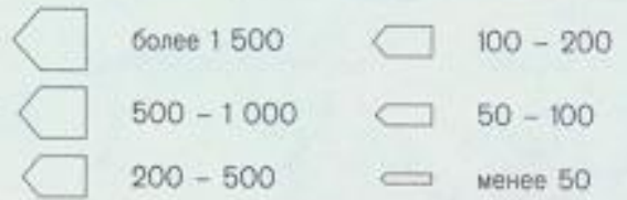
Цифрами на карте обозначены: