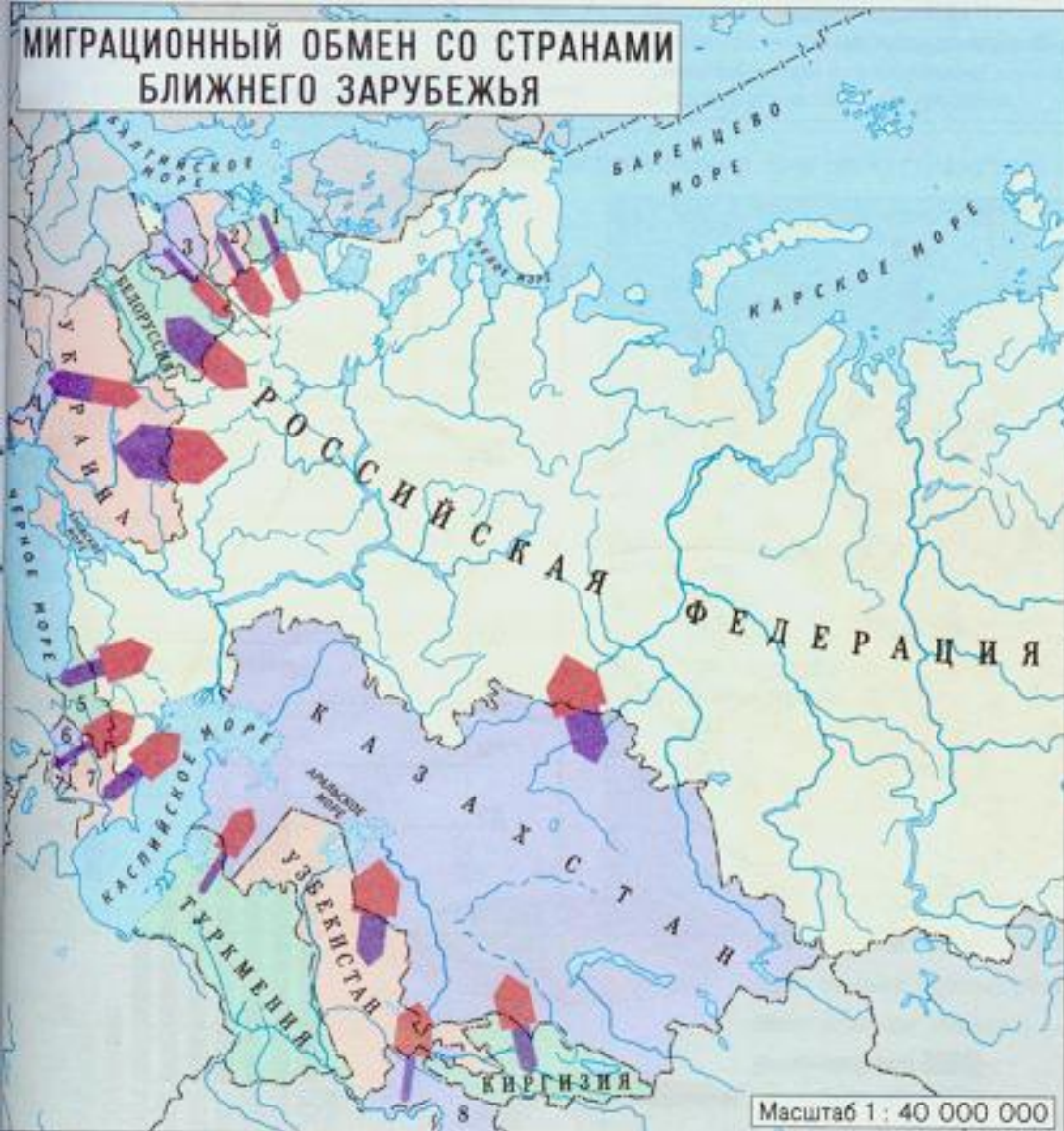
Миграция населения. 1990–2000 гг.