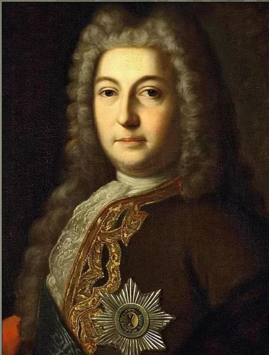
Андрей Иванович Остерман (1687-1747). Неизвестный художник. 1730-е гг.