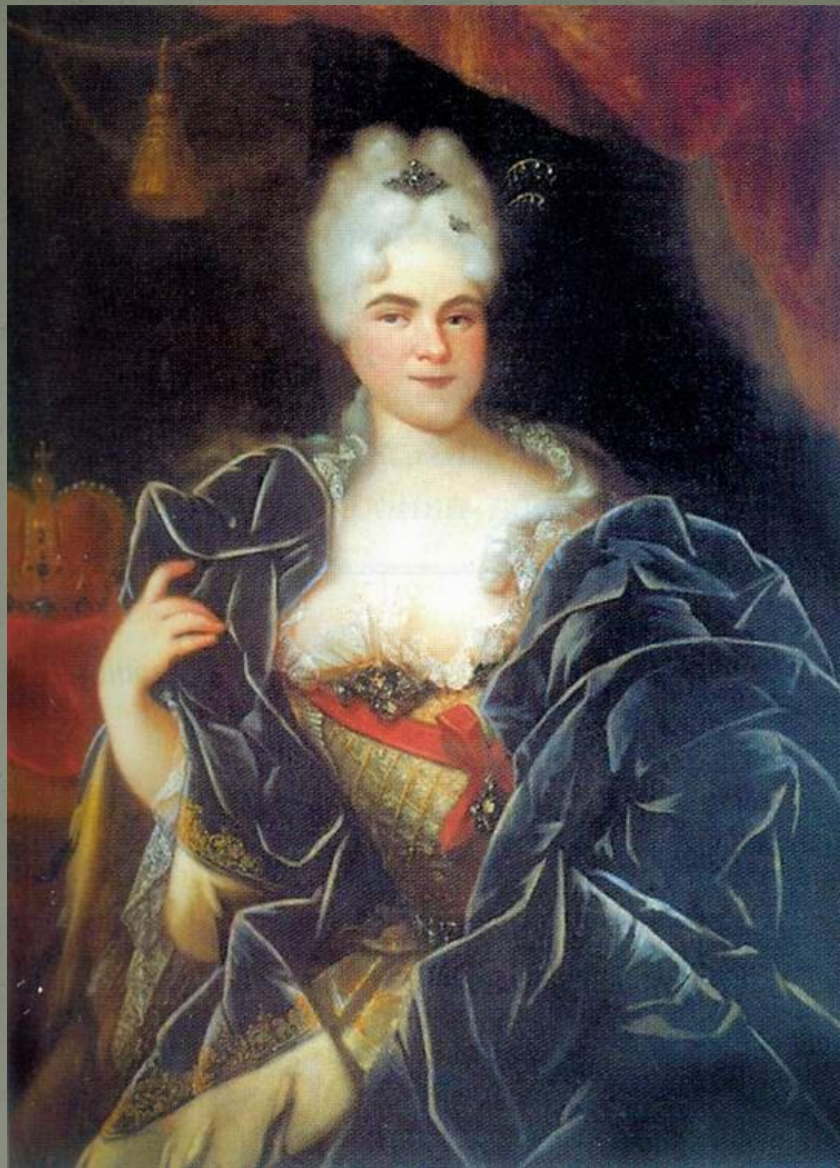
Иван Никитин. Портрет Екатерины I. 1717 год. Флоренция.