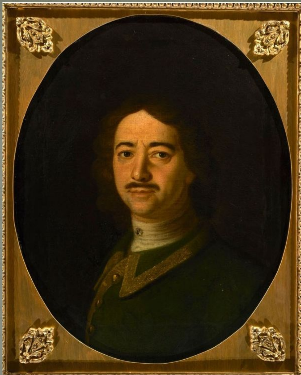
Портрет Петра I. 1722. Художник Луи Каравакк (1684-1754). Государственный Русский музей, Санкт-Петербург.