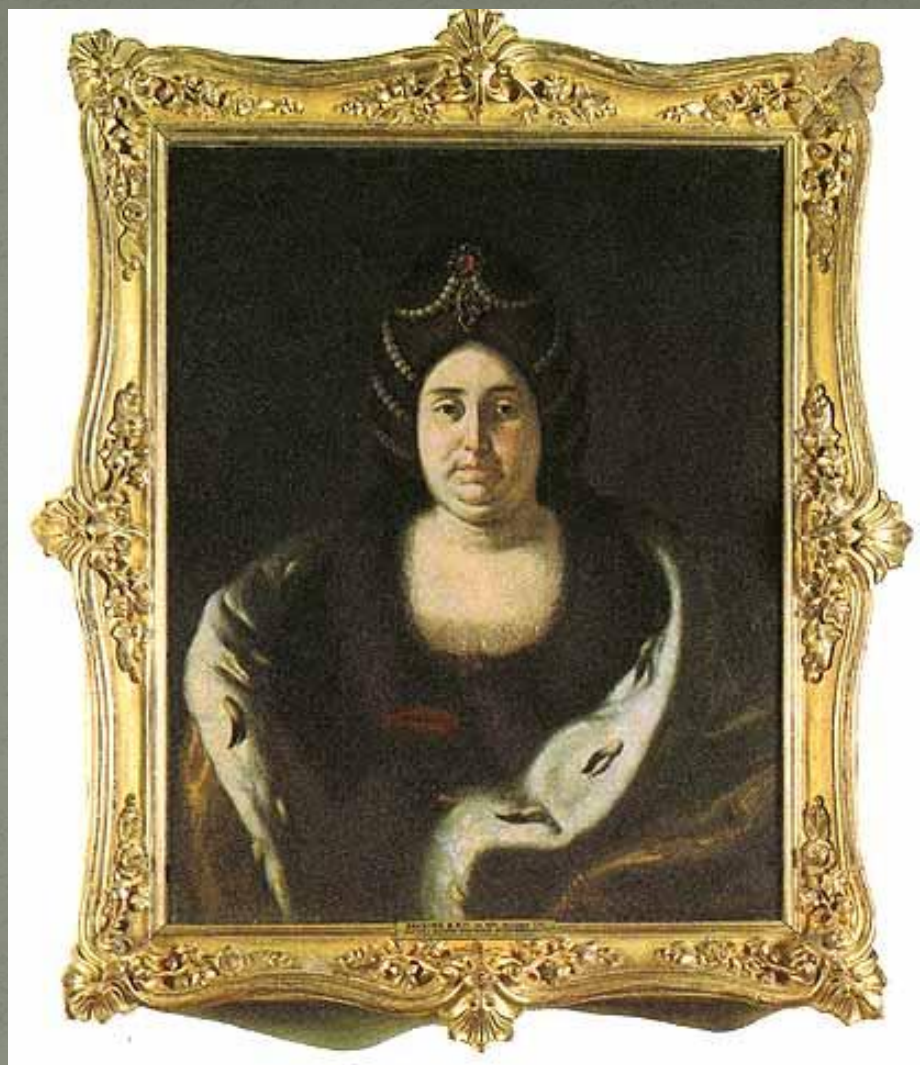
Иван Никитин. Портрет царицы Прасковьи Фёдоровны (1664-1723) в пожилом возрасте.