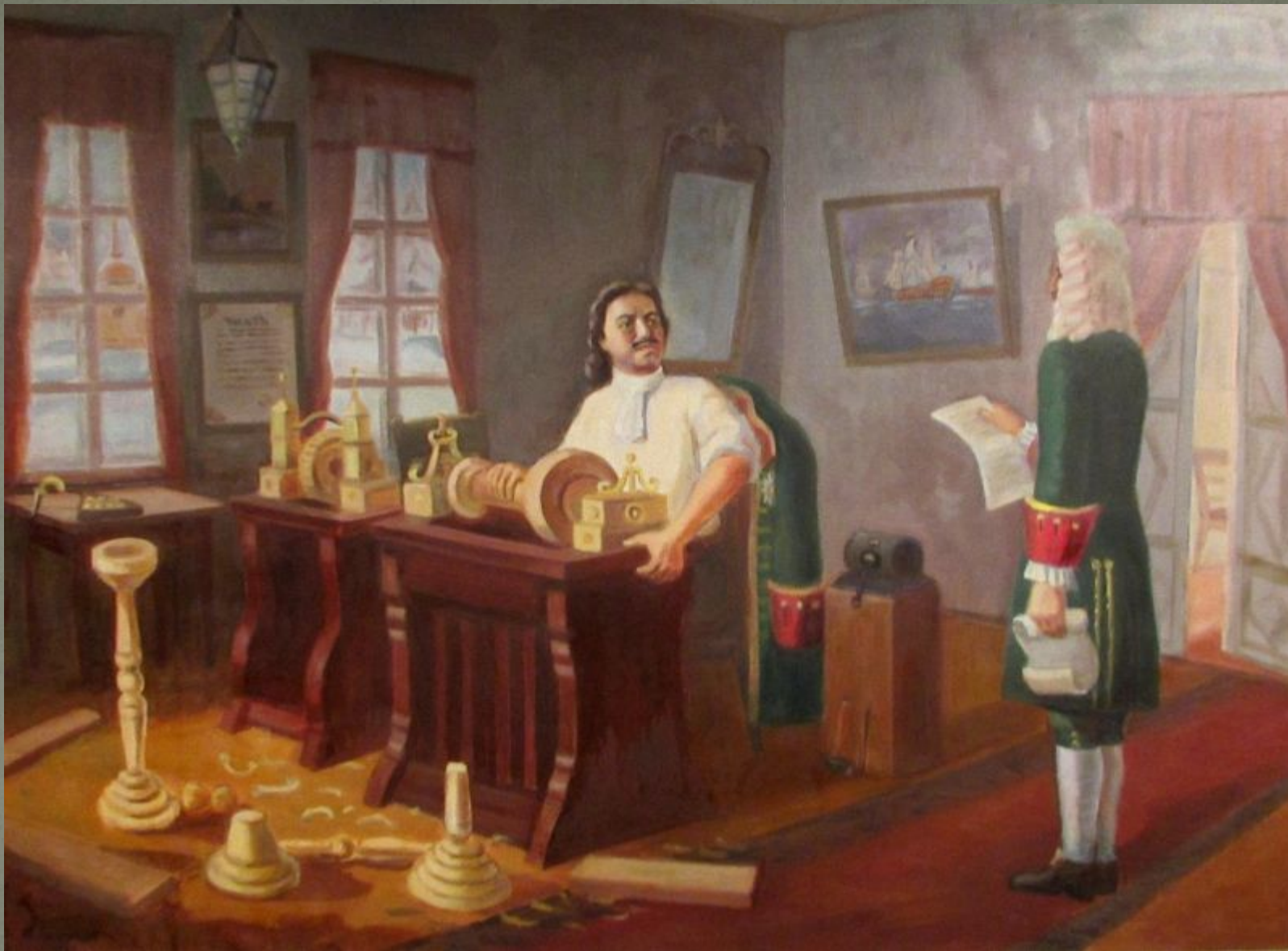
Голенищев И.Г. Петр I в столярной мастерской. 1940-е гг. Музей истории Марциальных вод.