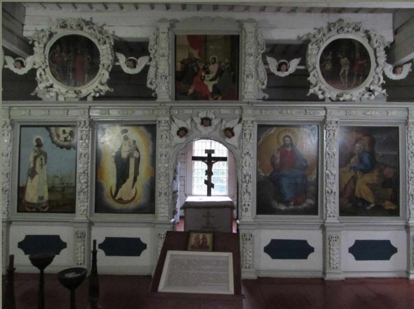
Иконостас церкви во имя святого апостола Петра.