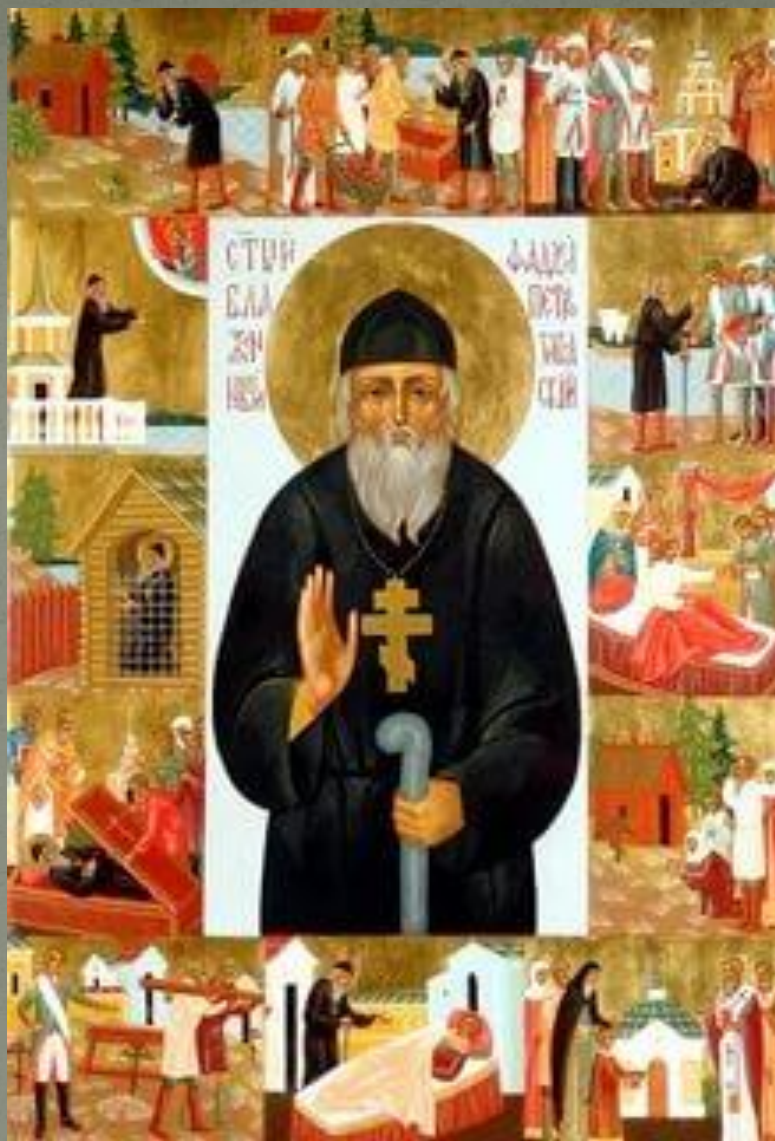
Фаддей Блаженный (Петрозаводский) (ум. в 1726 году), по преданию предсказавший скорую кончину Петра I.