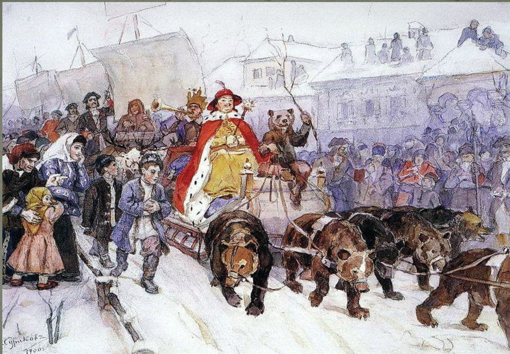
Суриков В.И. Большой маскарад в 1722 году на улицах Москвы с участием Петра I и князя-кесаря И. Ф. Ромодановского. 1900.