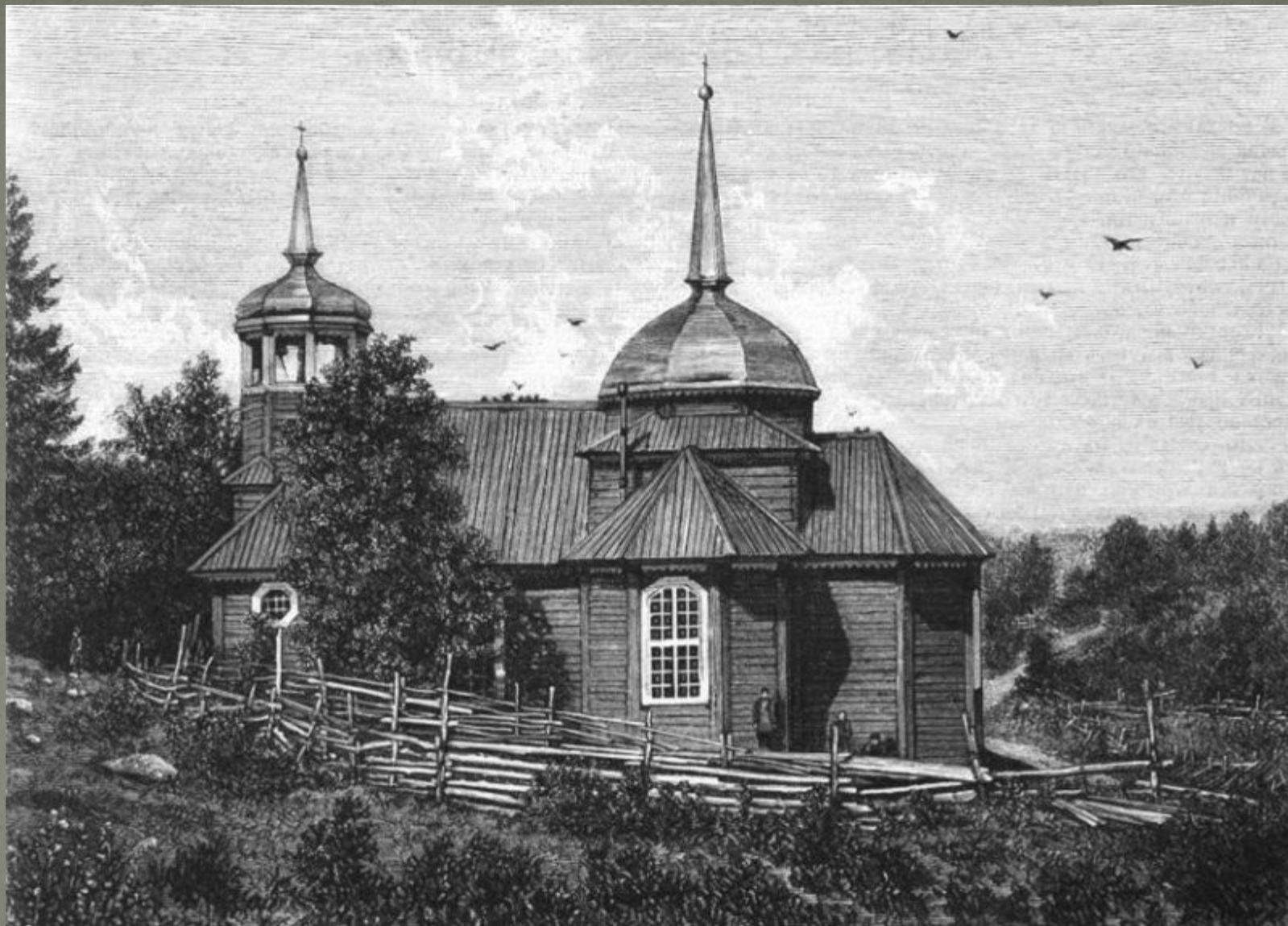
Рашевский М. Старинная церковь близ Марциальных вод в Олонецкой губернии (гравюра по фотографии Пекарского, XIX век).