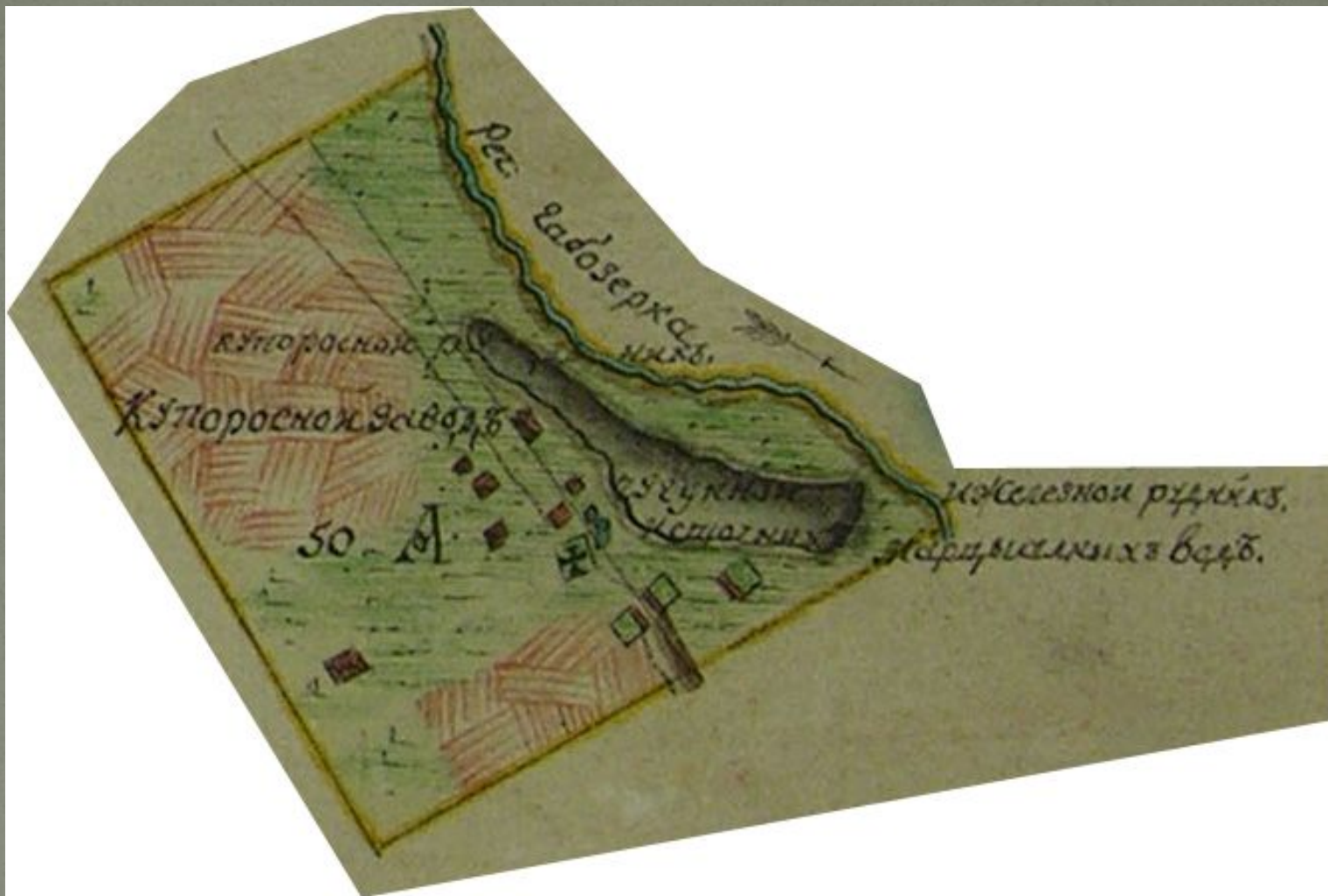
Марциальные воды и окружавшая их местность на карте Генерального межевания. Вторая половина XVIII века.