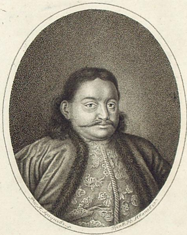
Князь Кесарь Федоръ Юрьевичъ Ромодановскій Ближній Стольникъ и Начальникъ Тайной Канцелярїи.