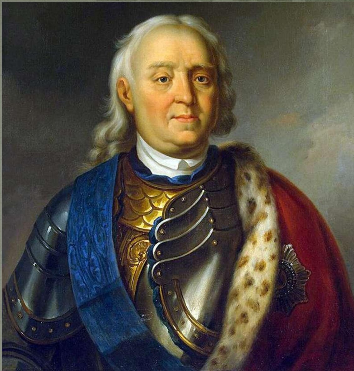
Портрет Федора Матвеевича Апраксина (1661-1728). Эрмитаж.