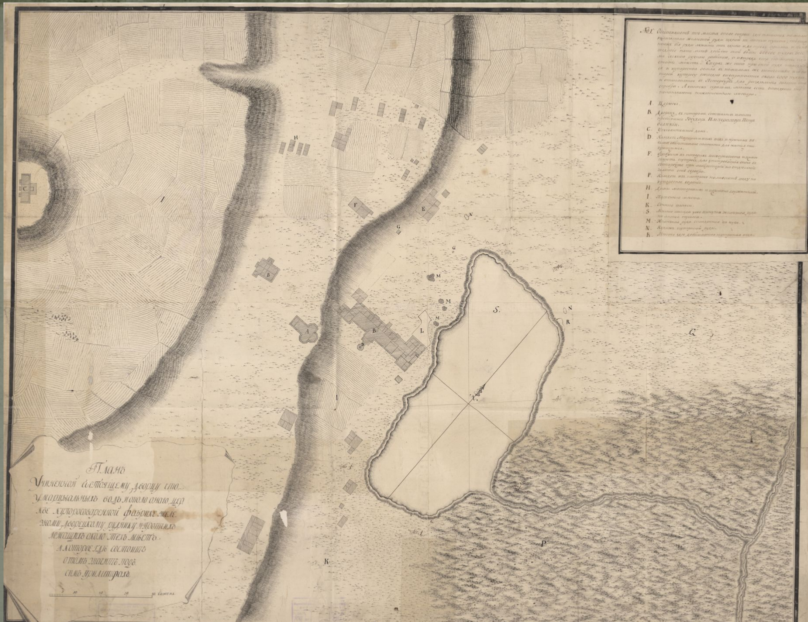
План, учиненный состоящему дворцу, что у Марциальных вод и около оноу церкви... Вторая половина XVIII века.