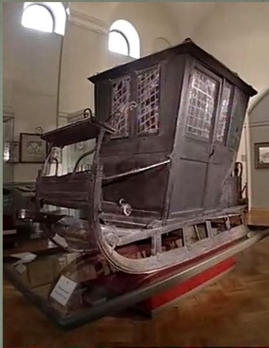
Зимний возок Петра I.