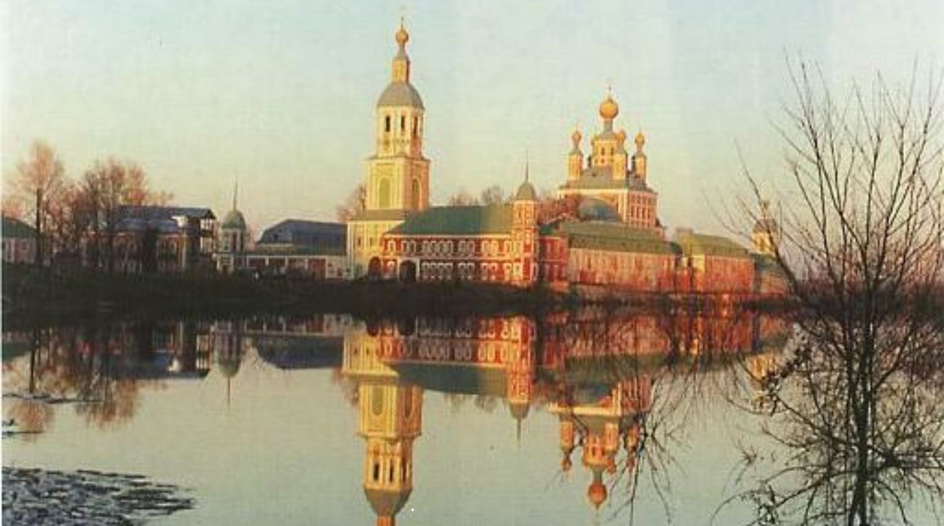
Санаксарский монастырь. Разлив, 2000г