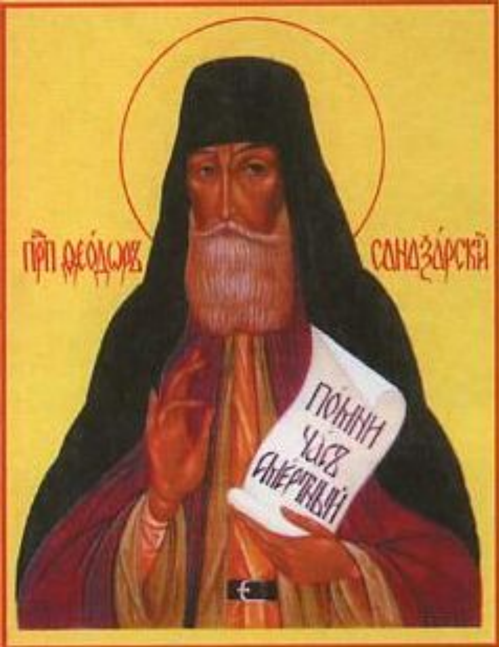
Икона святого праведного Федора Санаксарского

Верил Федор Санаксарски й в церковь, как в силу, способную утвердить в разуме людей