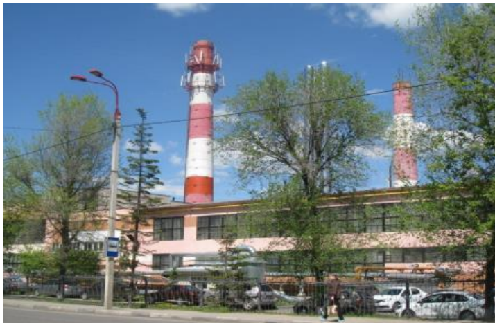
Котельная №21 ул. Звездная

Серная кислота – сильная двухосновная кислота, в стандартных условиях представляет собой маслянистую жидкость без цвета и запаха. Неочищенная серная кислота имеет желтоватый или буро-желтый цвет. В технике серной кислотой называют ее смеси как с водой, так и с серным ангидридом. Температура плавления – 10,38 °С