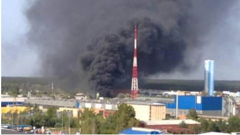
Пожар на предприятии УРСА Серпухов 2015г.

Фенол – летучее вещество с характерным резким запахом. Пары его ядовиты. При попадании на кожу фенол вызывает болезненные ожоги.