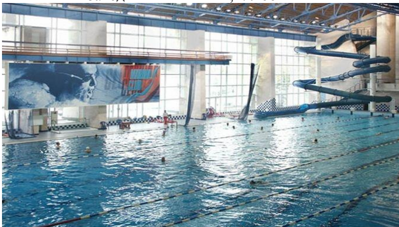
Бассейн «ЦСК ВМФ»