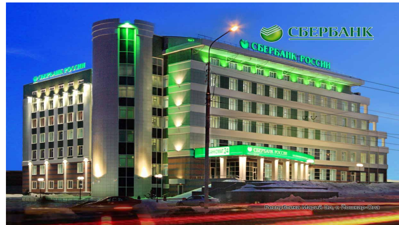
Сбербанк России (несколько отделений)