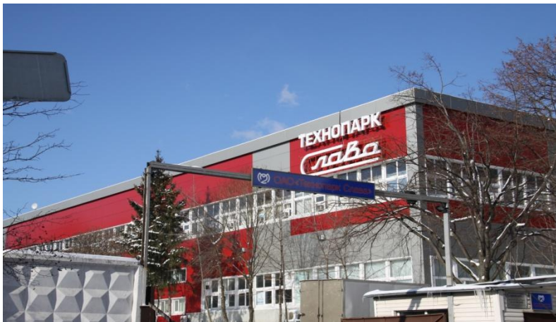
«Технопарк Слава», Научный проезд 20/2