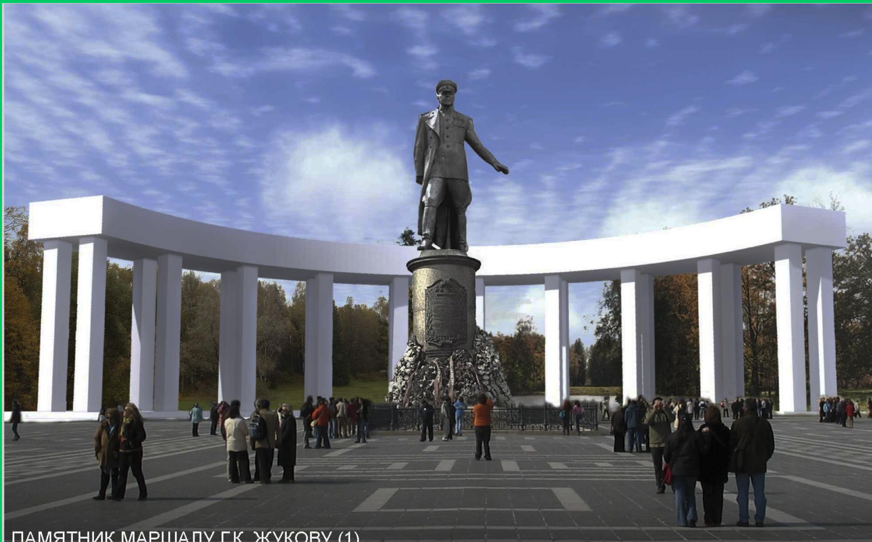
ПАМЯТНИК МАРШАЛУ Г.К. ЖУКОВУ (1)