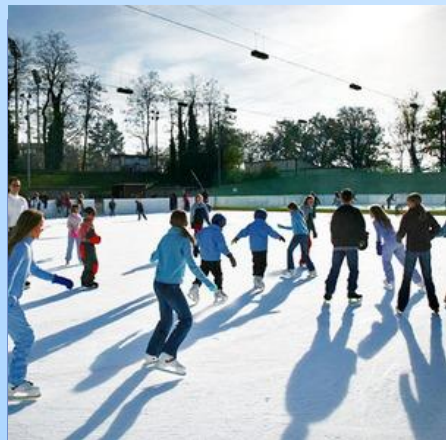
Каток под открытым небом