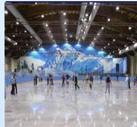
Каток под металло- конструкцией