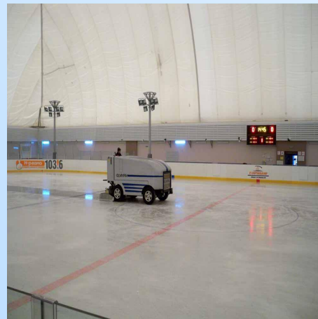
Каток под воздухоопорной конструкцией