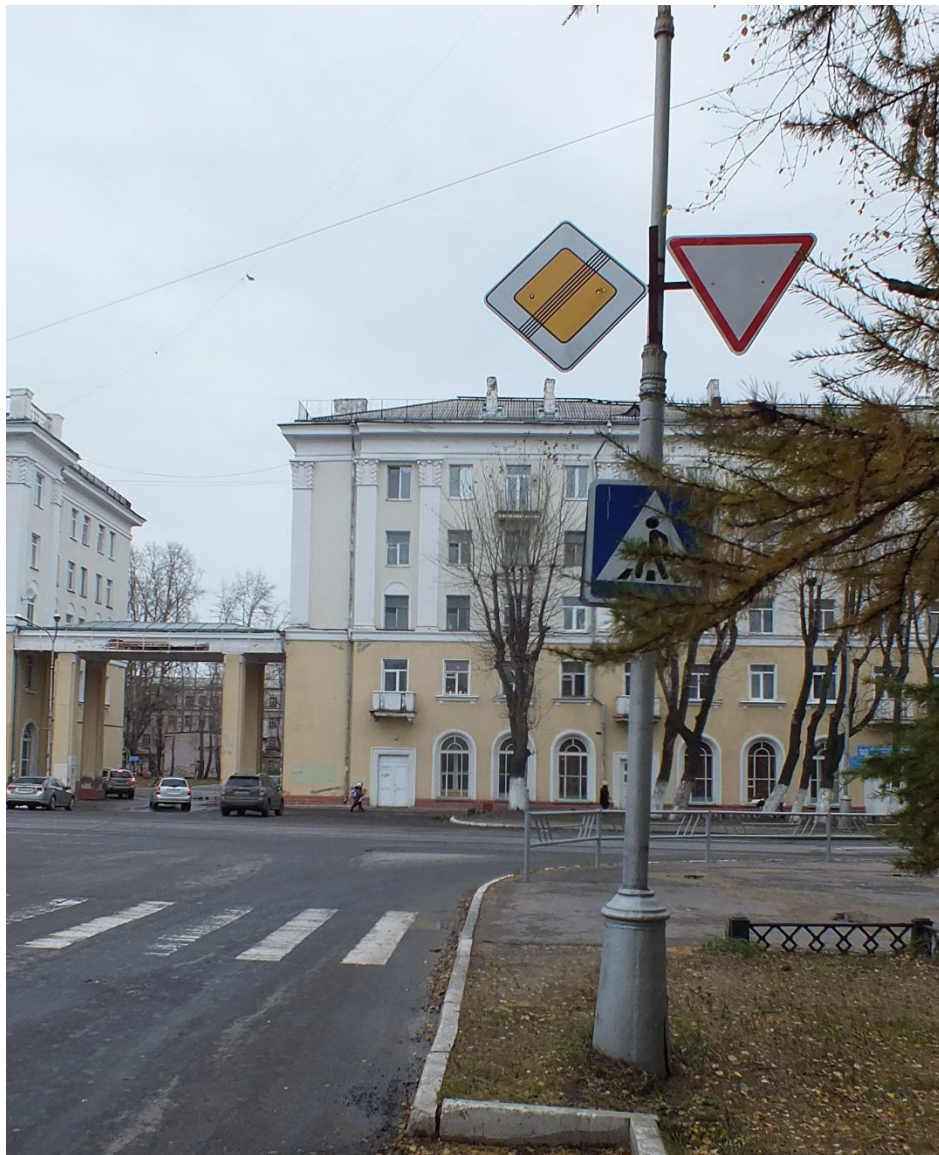
Автошкола НАША МАРКА 89027026102