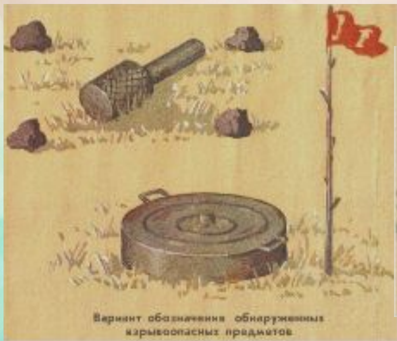
Вариант обозначения обнаруженных взрывоопасных предметов

Для устройства ограждения можно использовать различные подручные материалы (жерди, колья, проволоку, веревки, куски материи, камни, грунт и другие).