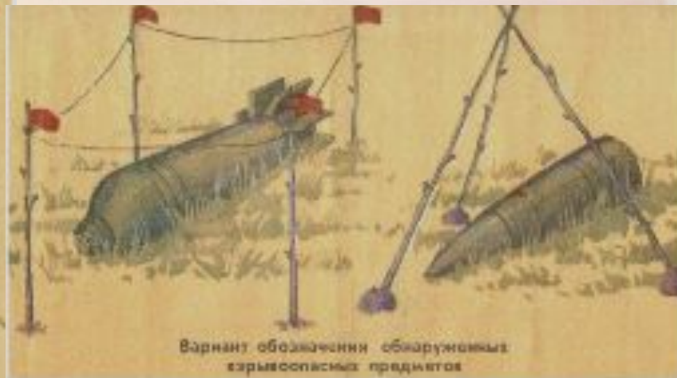
Вариант обозначения обнаруженных взрывоопасных предметов