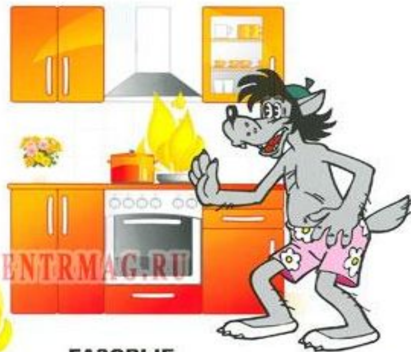
ГАЗОВЫЕ И ЭЛЕКТРИЧЕСКИЕ ПЕЧИ