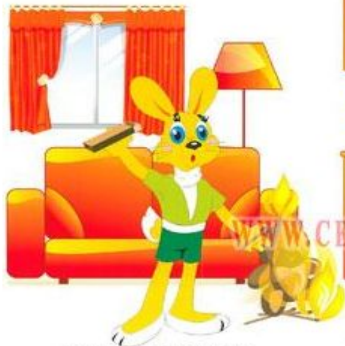
НЕОСТОРОЖНОЕ ОБРАЩЕНИЕ С ОГНЁМ