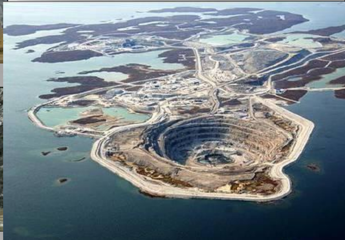
Карьер "Дьявик" (Diavik)