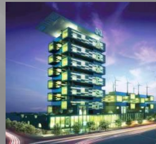
Теплица - небоскреб