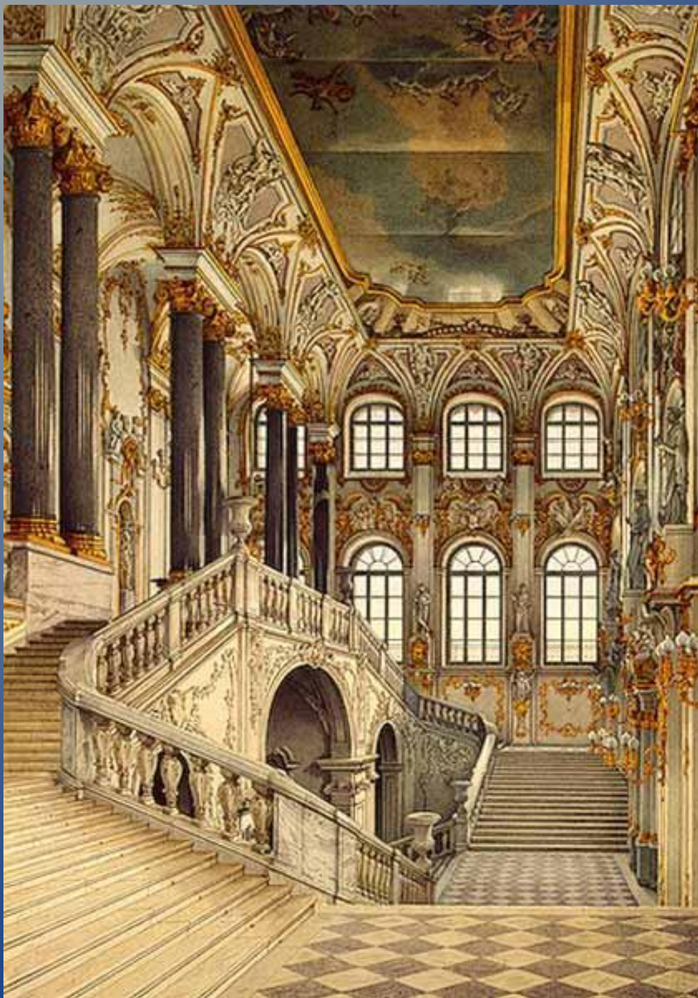
Парадная Иорданская лестница. Акварель К.А. Ухтомского. 1860-е гг. ГЭ Бумага, акварель. 44,2 x 31,3