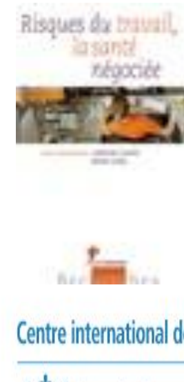
Risques du travail, la santé négociée Catherine Courtet et Michel Gollac La Découverte, 2012

Centre international de Recherche sur le Cancer