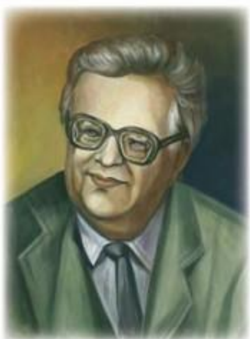
Берестов Валентин Дмитриевич (01.04.1928-15.04.1998)

Валентин Берестов стал одним из самых любимых детских поэтов второй половины минувшего века. Обаяние его весёлых «стишков» было настолько велико, что долгое время Валентин Берестов считался поэтом исключительно для малышей. Позже – для детей школьного возраста и взрослых.