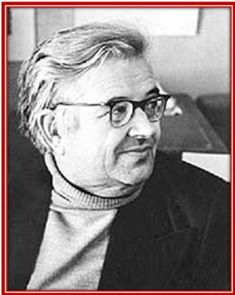
Берестов Валентин Дмитриевич 1928-1998