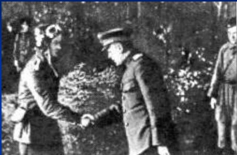
А.Новиков поздравляет Маресьева с присвоением звания Героя Советского Союза