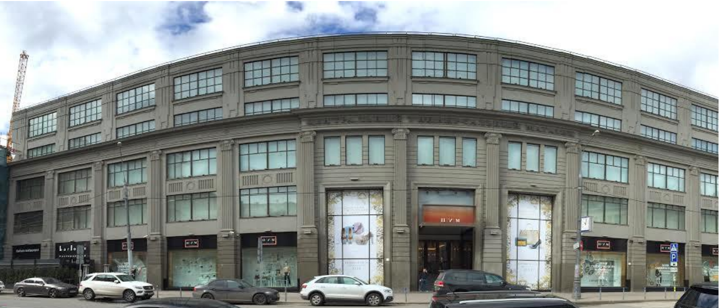
фасад здания тд. ЦУМ по ул. Неглинная