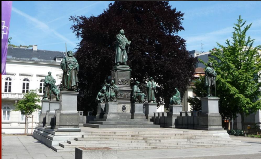
Мемориал Мартина Лютера