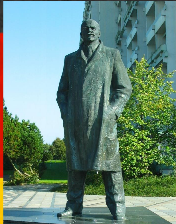
Памятник Ленину в Шверине