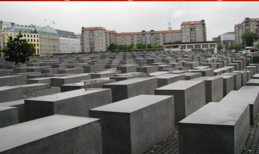
Мемориал жертвам Холокоста