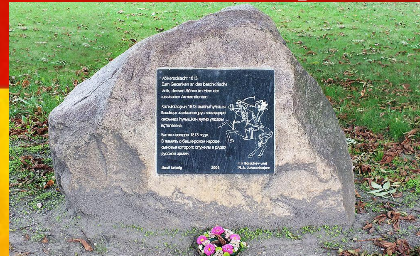
Памятник башкирским участникам Отечественной войны 1812г.