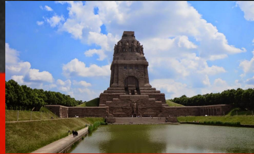
Памятник битве народов