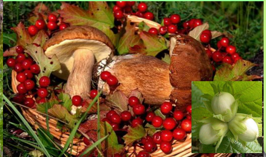
Источник чистой ВОДЫ И ПИЩИ