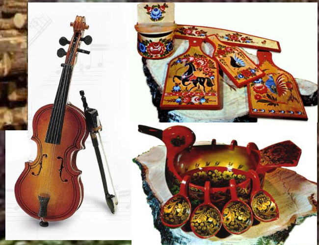
декоративные изделия музыкальные инструменты