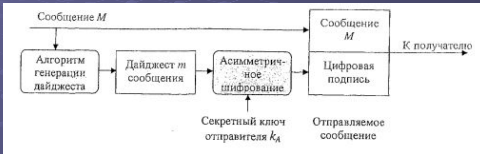
Рисунок 1 – Схема формирования электронной цифровой подписи

Сообщение M вместе с цифровой подписью отправляется в адрес получателя.