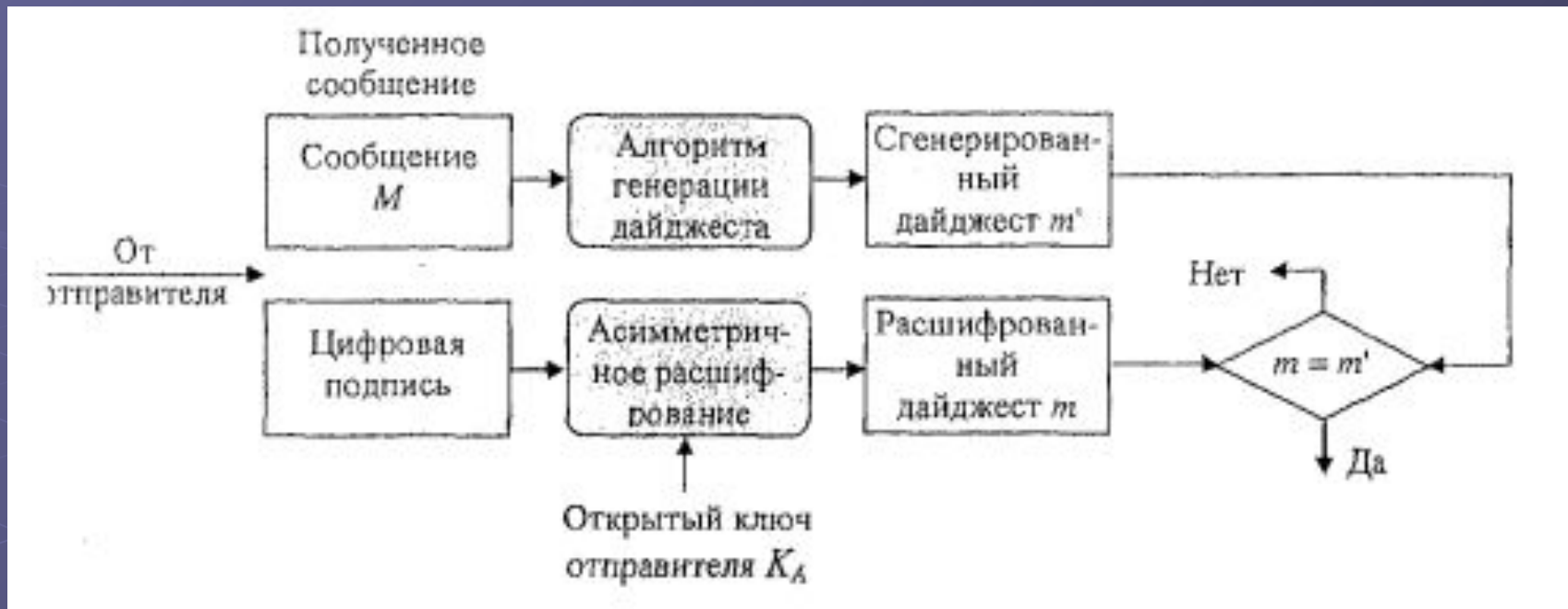
Рисунок 2 - Схема проверки электронной цифровой подписи