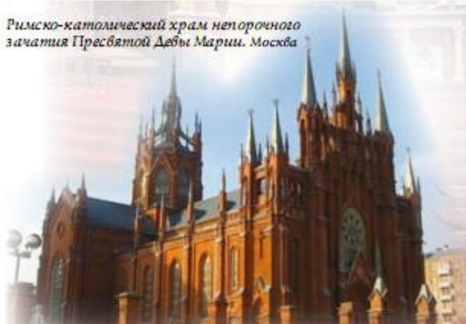
Римско-католический храм непорочного зачатия Пресвятой Девы Марии. Москва

Архитектура, скульптура, живопись, таинство литургического действия в православном храме соотносятся с хоровым пением без сопровождения (акапелла). В католическом — не только с пением, но и со звучанием органа.