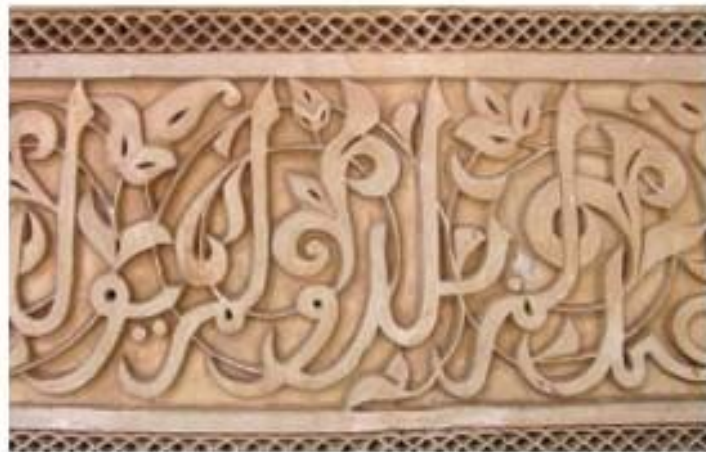
Каллиграфический орнамент. Марокко