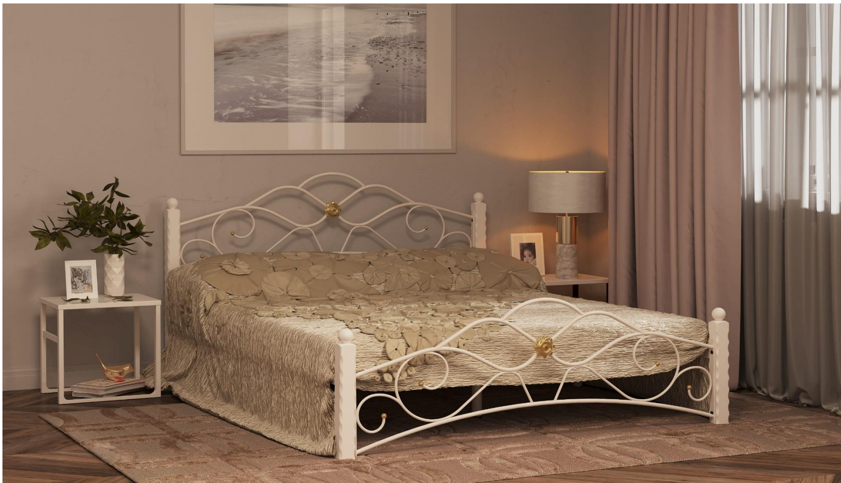
Кровать «Garda 3» : Сталь и массив березы