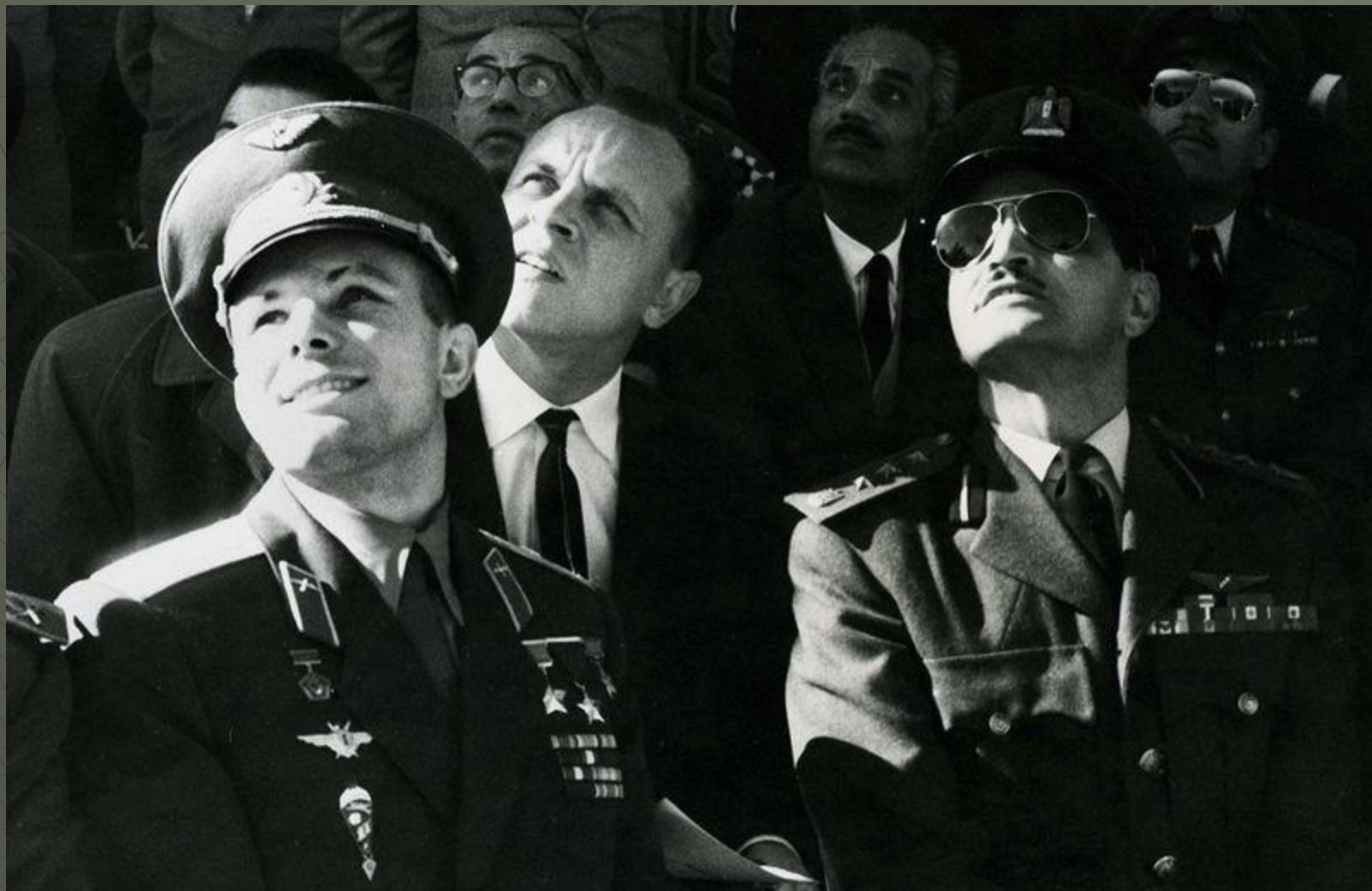
Юрий Гагарин на военном авиапараде, Египет, 1962 год