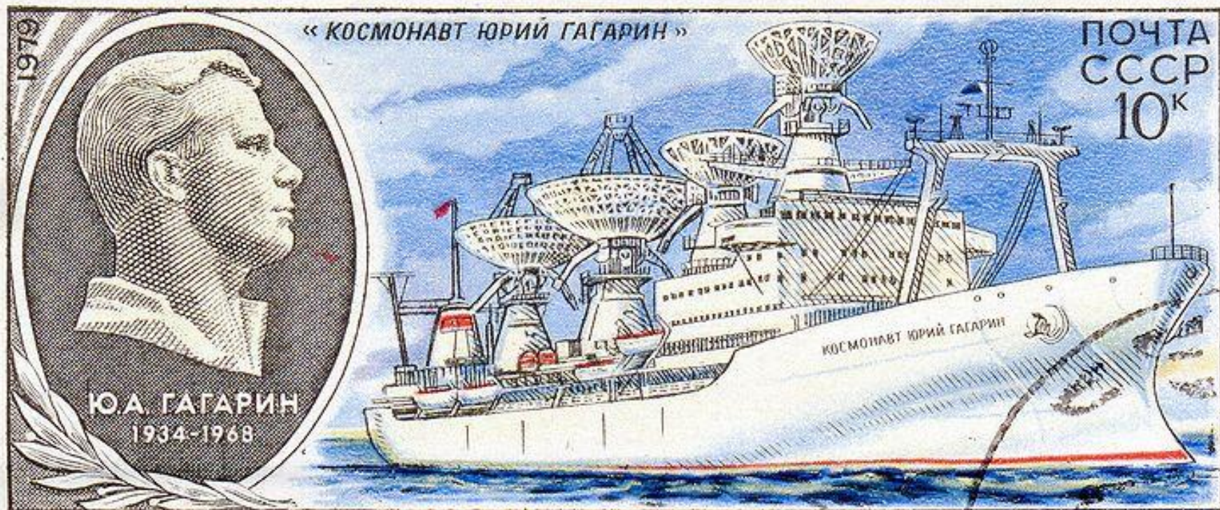
Научно-исследовательское судно «Космонавт Юрий Гагарин» и портрет Гагарина на почтовой марке СССР