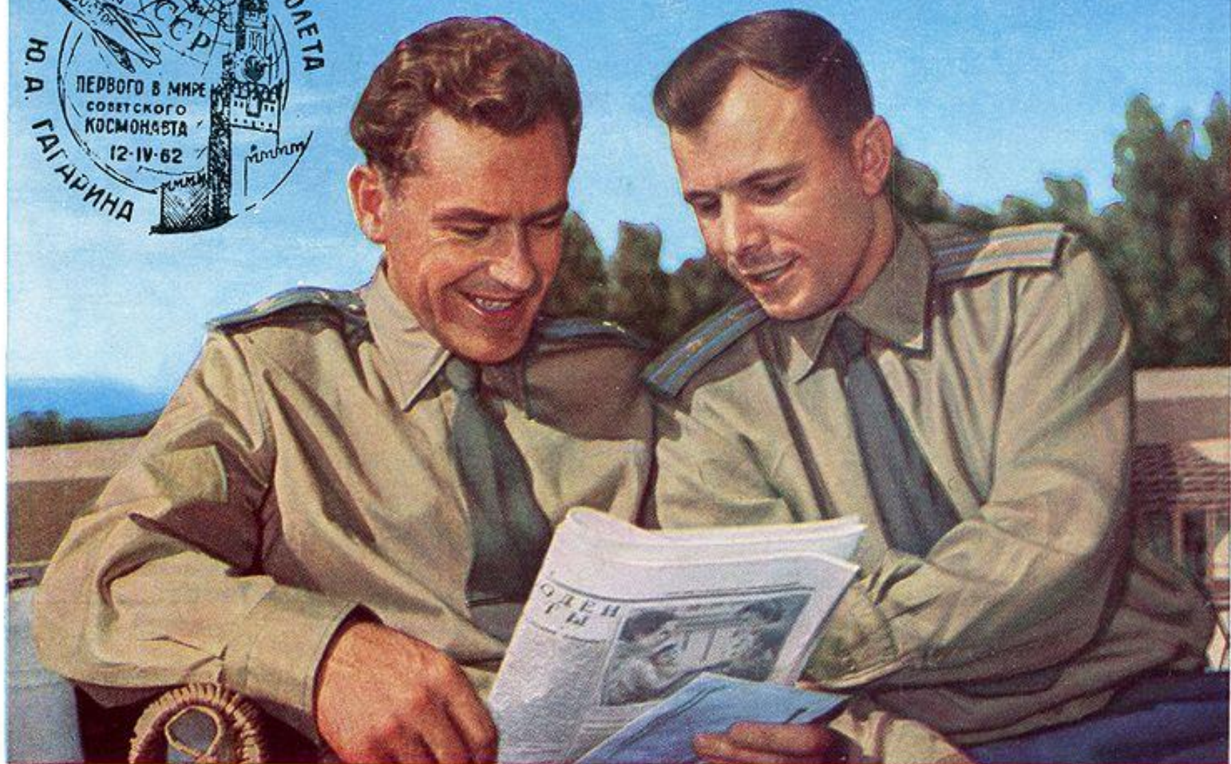
Почтовая карточка, на которой изображён Ю. Гагарин и Г. Титов