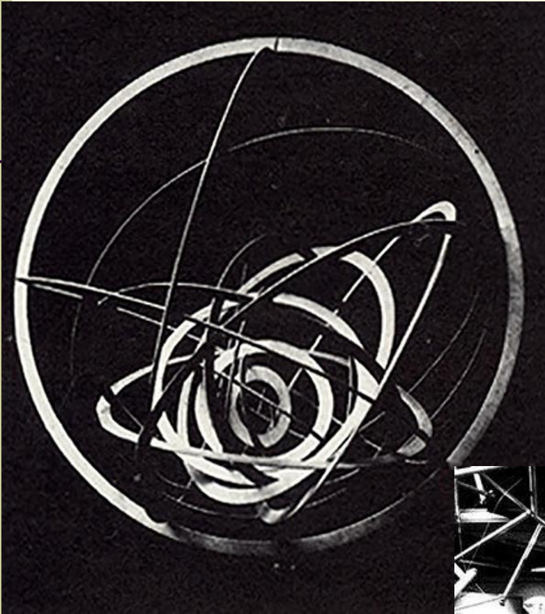
Робота Наума Габо