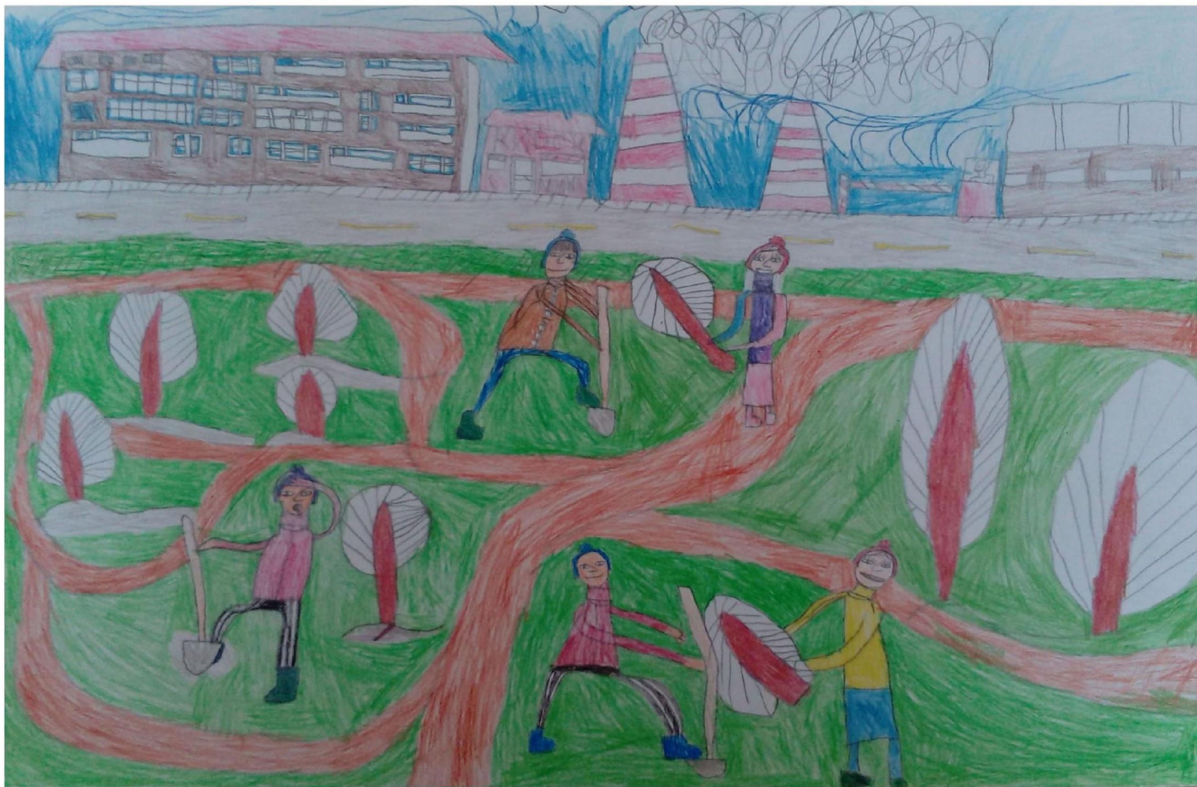
Рыбников Ярослав 7 лет