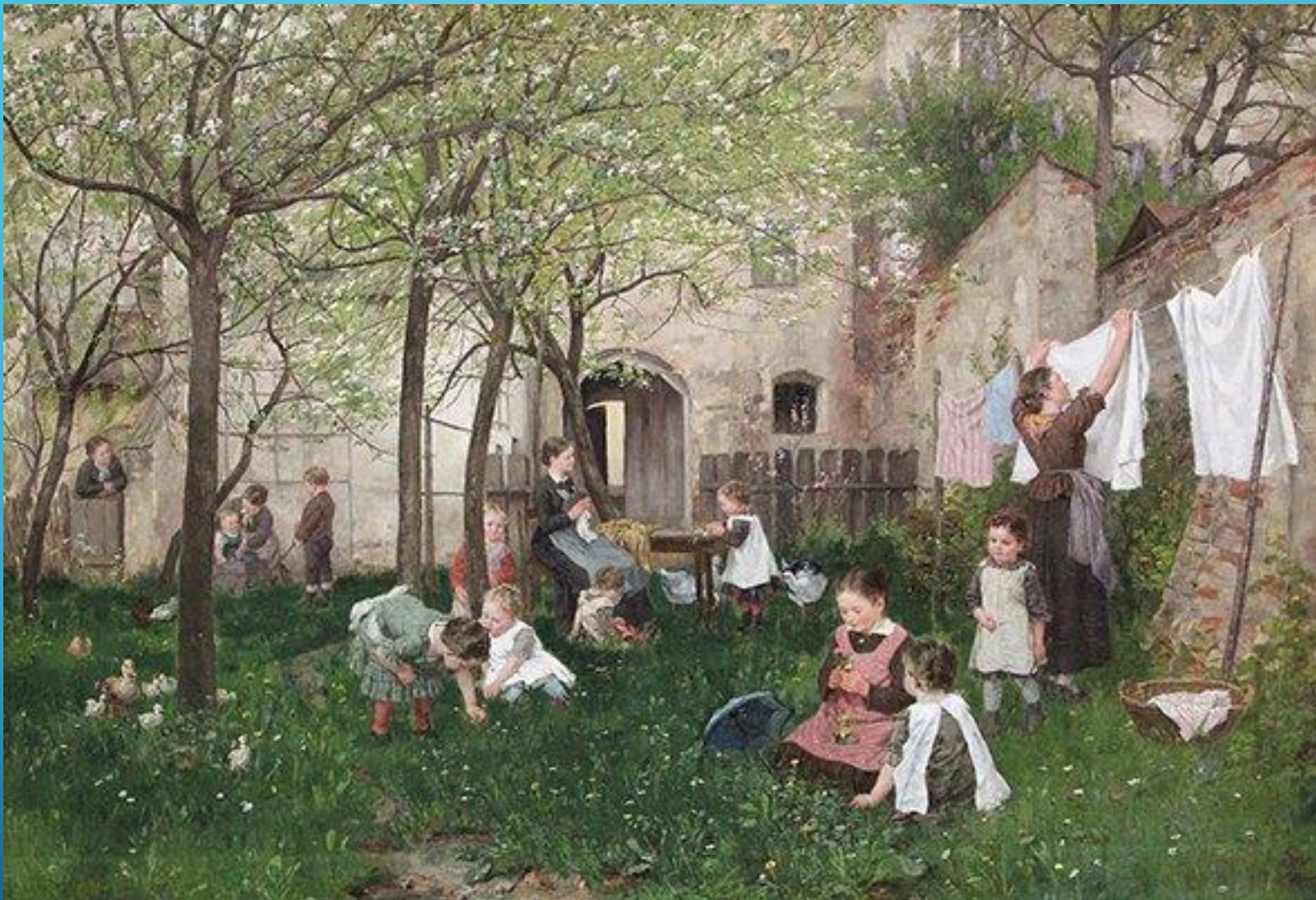
Фрагмент картины Иоганна Сперла «Детский сад»