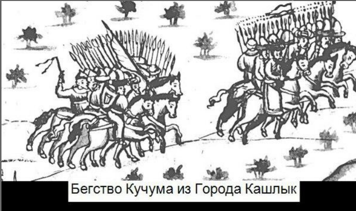
Бегство Кучума из Города Кашлык