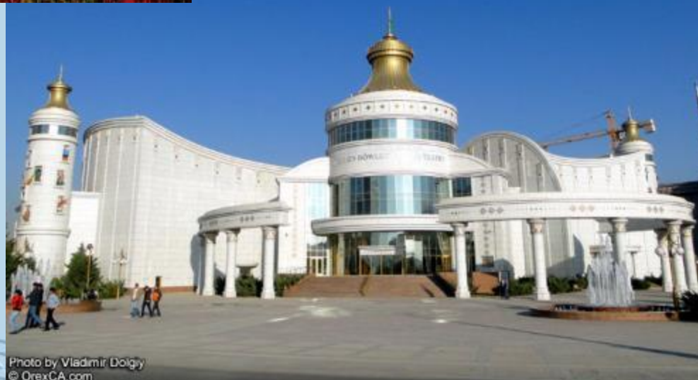
Туркменский оперный театр