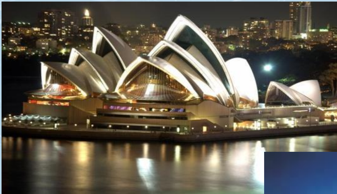
Оперный театр в Сиднее