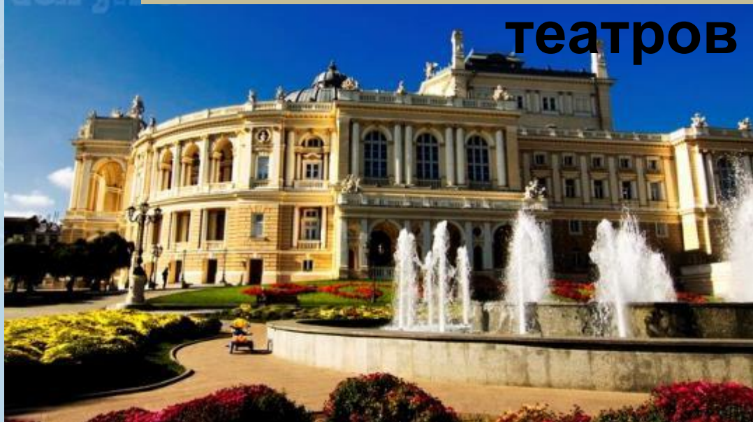
Одесский оперный театр