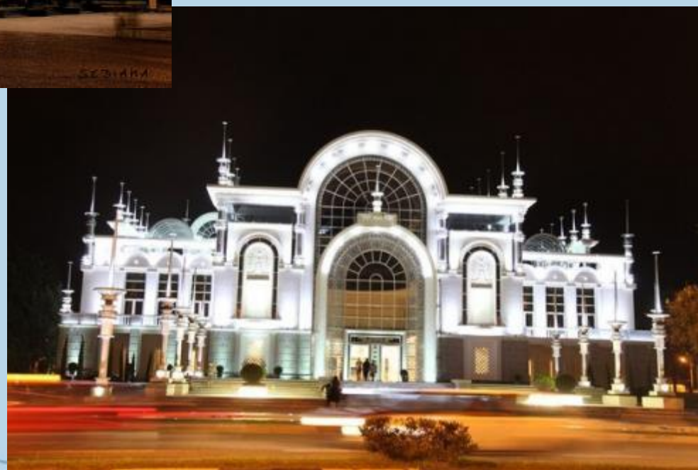
Оперный театр в Батуми