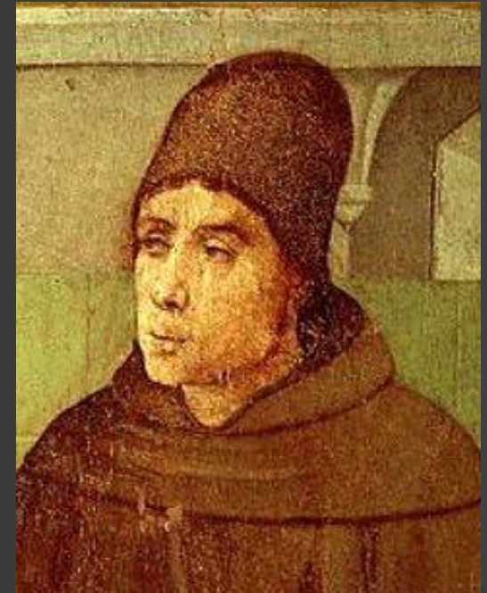
Дунс Скот 1270-1308