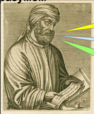
Квинт Септимий Флоренс Тертуллиан 155/156 — 220/240 гг