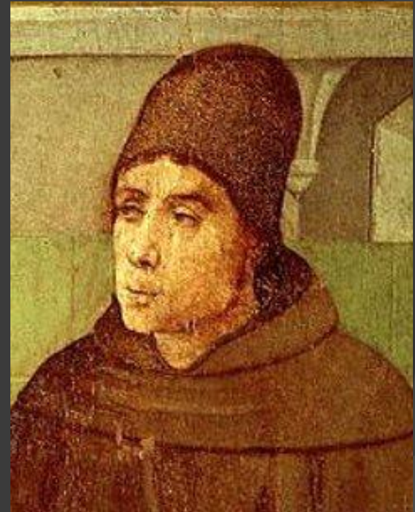
Дунс Скот 1270-1308