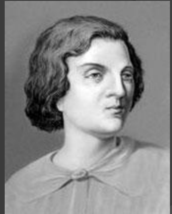
Петр Абеляр 1079-1142