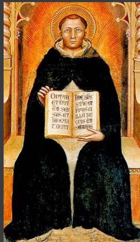
Фома Аквинский 1221-1274