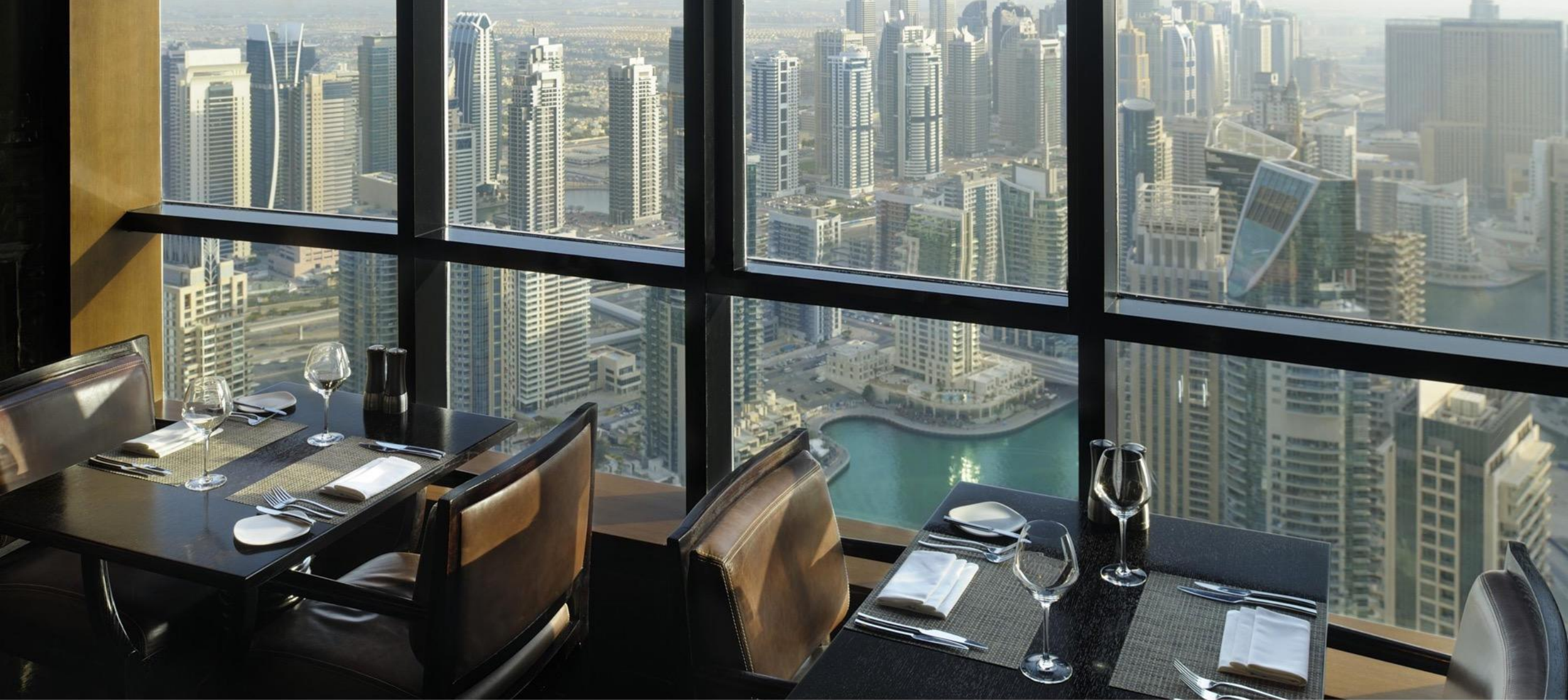
The Observatory - Dubai Marina - Marriott Harbour Hotel