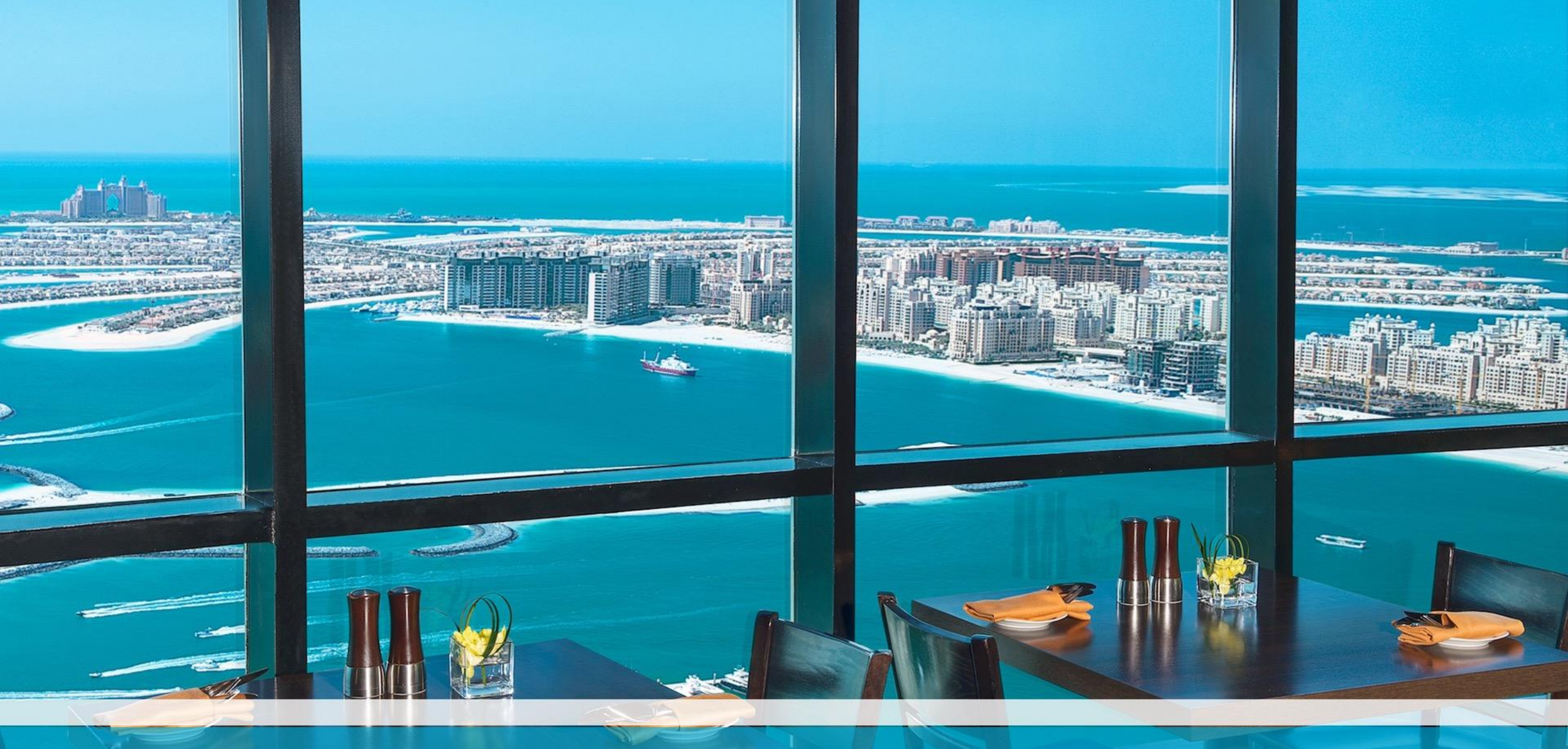
The Observatory - Dubai Marina - Marriott Harbour Hotel