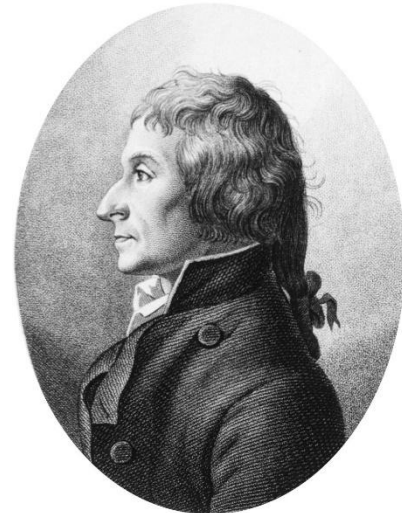
Жозеф Луи Пруст

Закон справедлив только для молекулярных веществ!