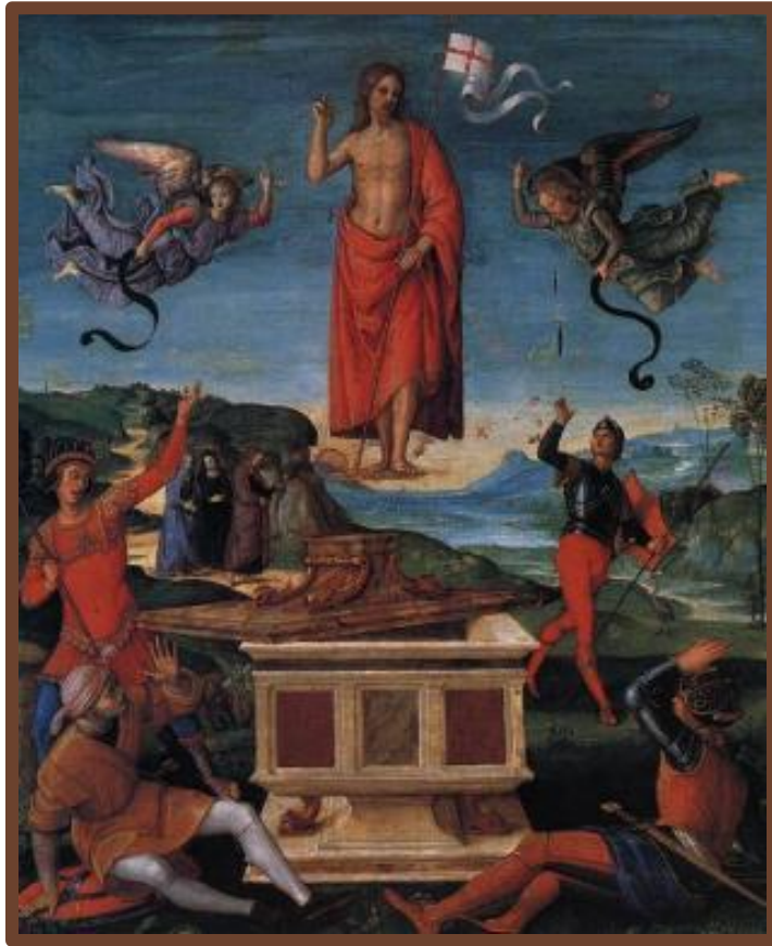
Рембрандт. Воскресение Христа

Возникновение христианства Иисус Христос в Иудее при императорах Августе и Тиберии. Осужден Понтием Пилатом и казнен в Иерусалиме. (Жертва ради искупления грехов человечества).