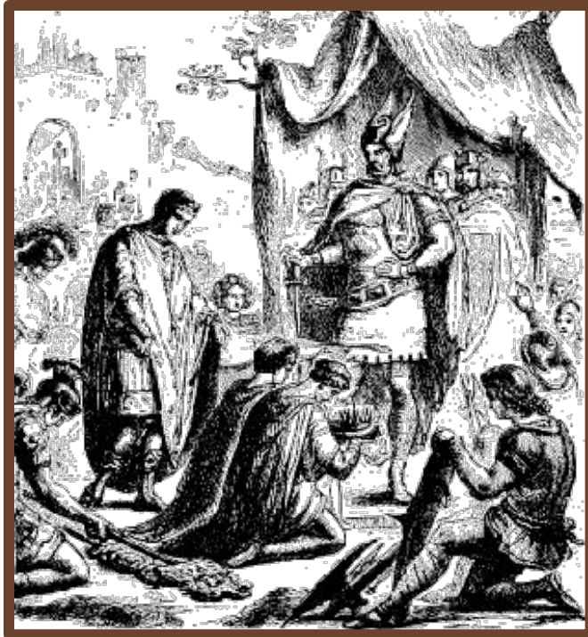
Ромул Август преподносит корону Одоакру