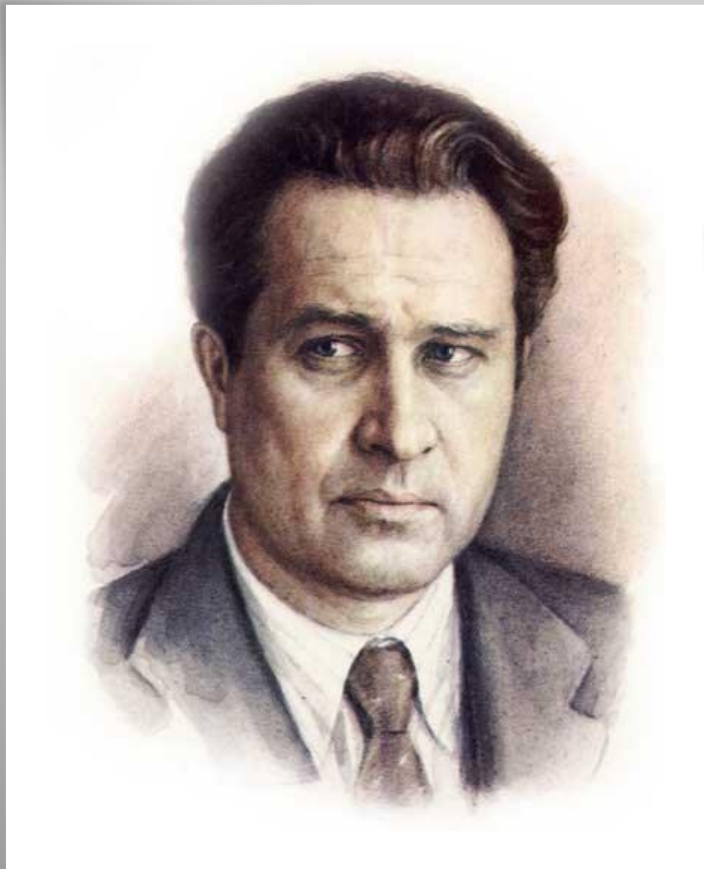
Борис Андреевич Мокроусов