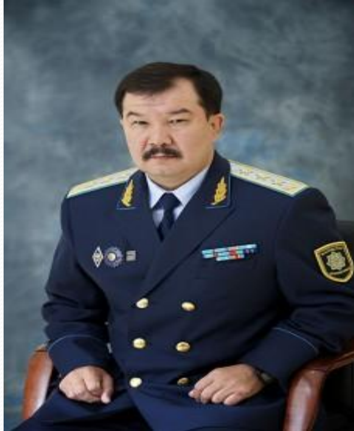
Қазақстан Республикасының Бас Прокуроры Дауылбаев Асхат Қайзоллаұлы