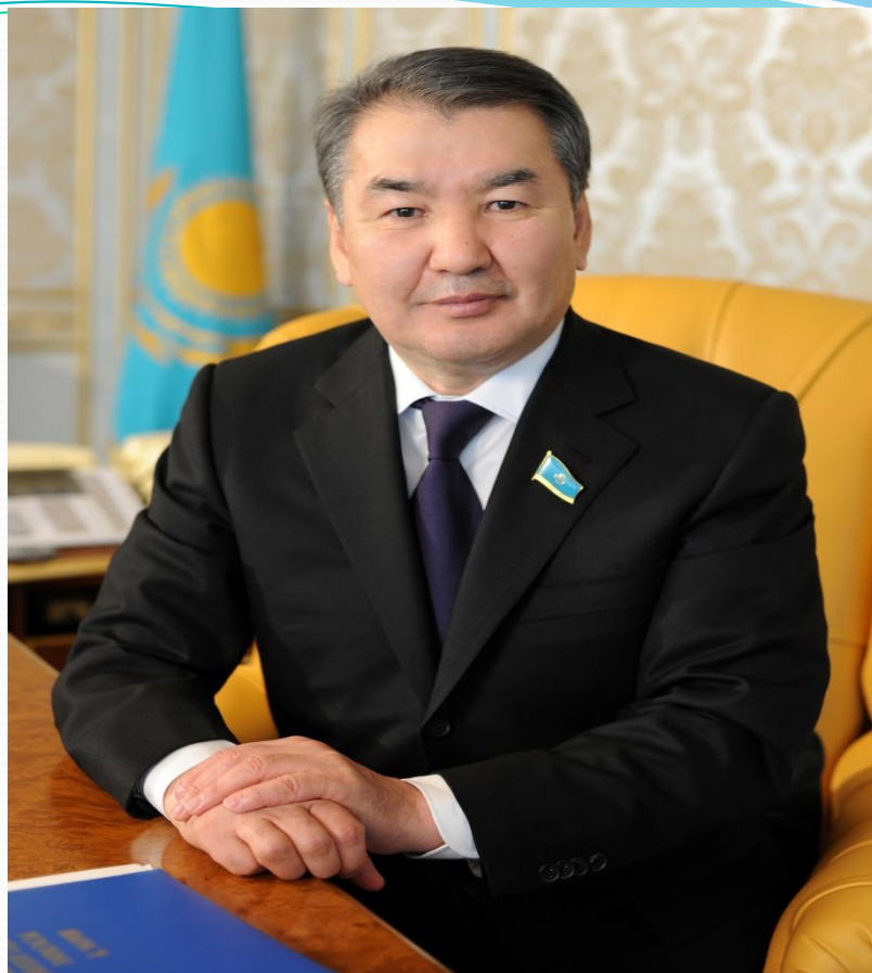
• Жоғарғы Сот Төрағасы Мами Қайрат Әбдіразақұлы