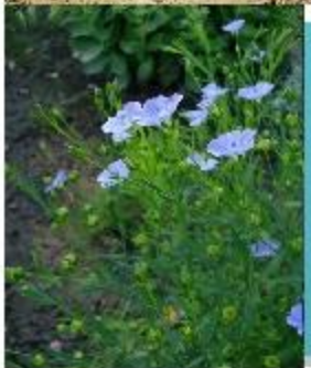
Лен - долгунец

1/2 - Центрально-Черноземный район 1/3 – Северный Кавказ (Краснодарский край)