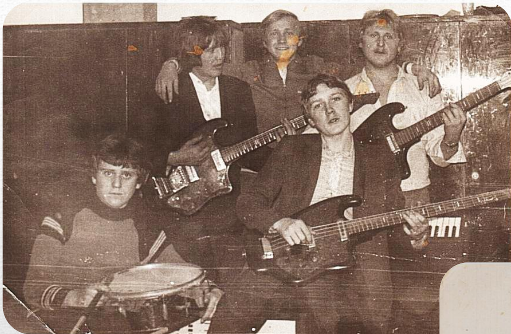
ВИА «Импульс» 1983 год