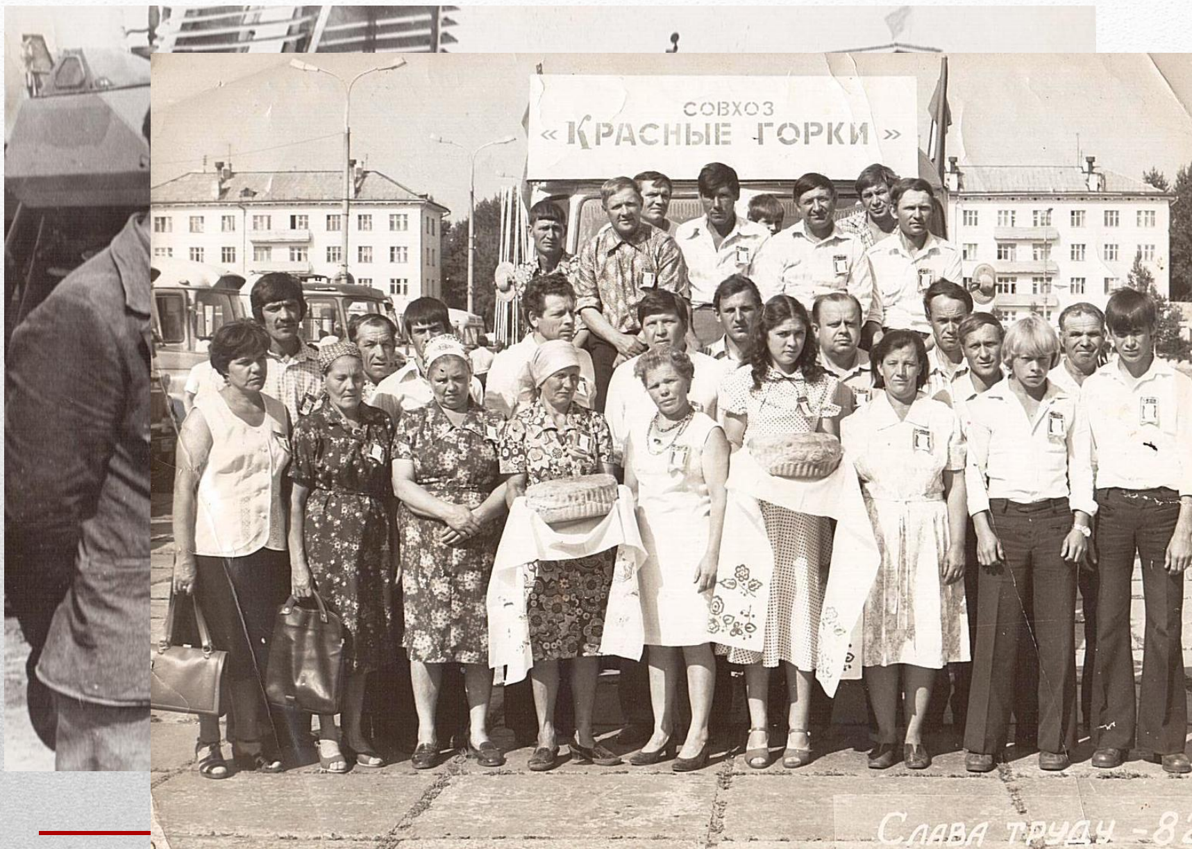
СЛАВА ТРУДУ - 82