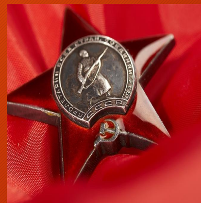
Орден Красная звезда