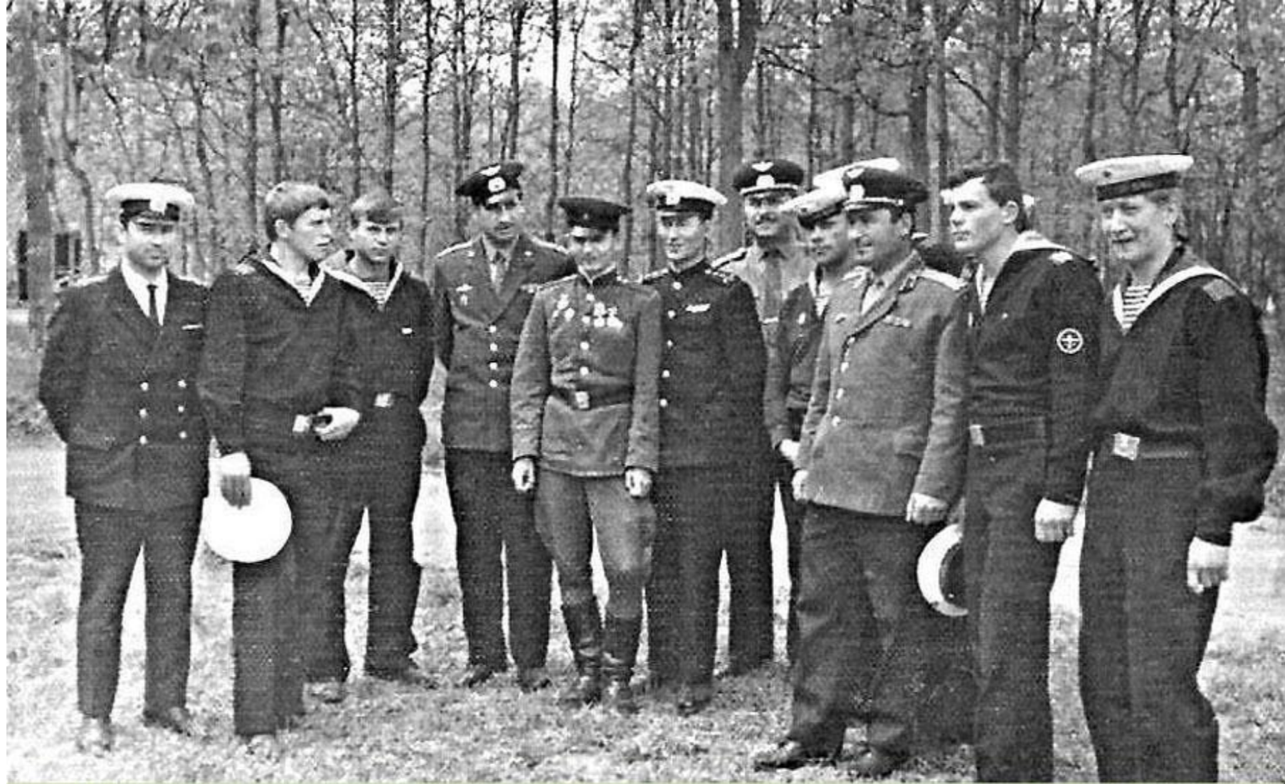
На снимке защитники острова Даманский, участники военных событий, развернувшихся на советско-китайской границе в марте 1969 года - моряки речной пограничной охраны в/ч 2538, авиаторы 10-ой отдельной авиационной эскадрильи и бойцы 57-го (Иманского) пограничного отряда. Май 1969 года.