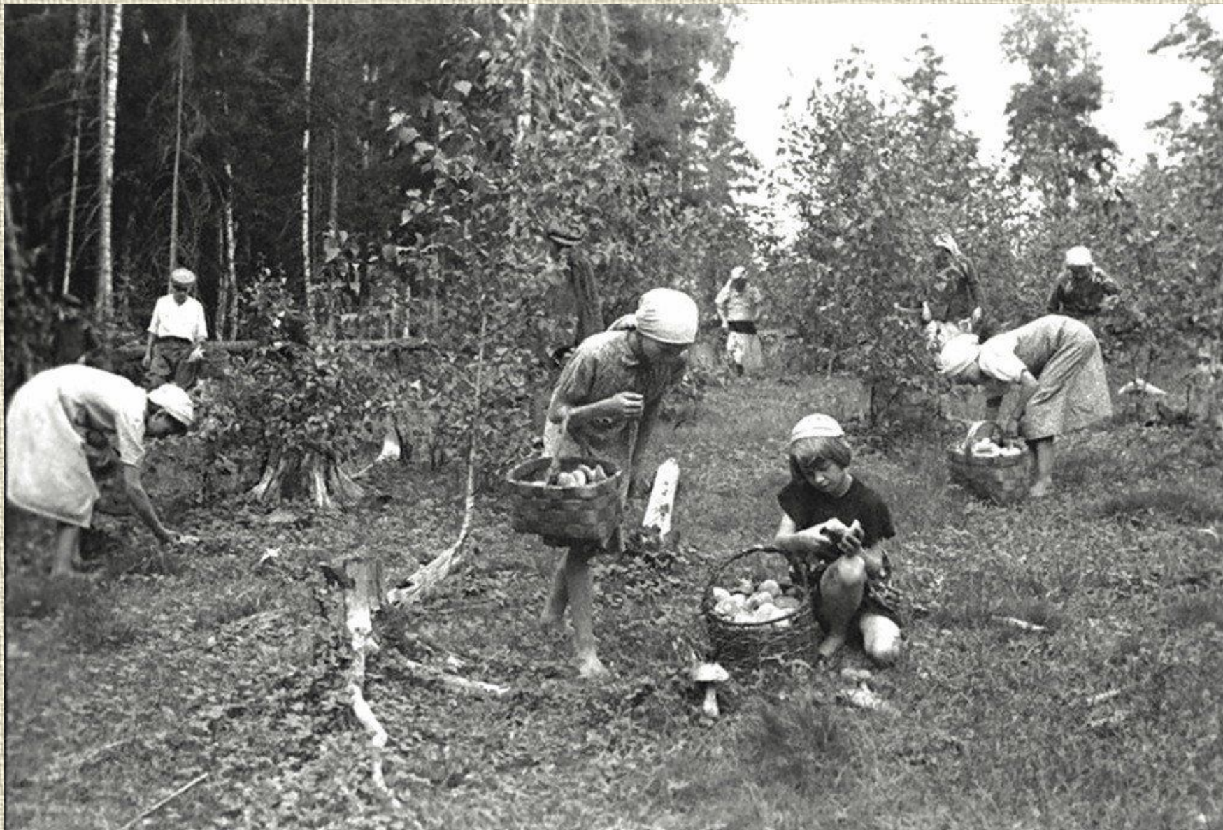
Собирали грибы и ягоды.