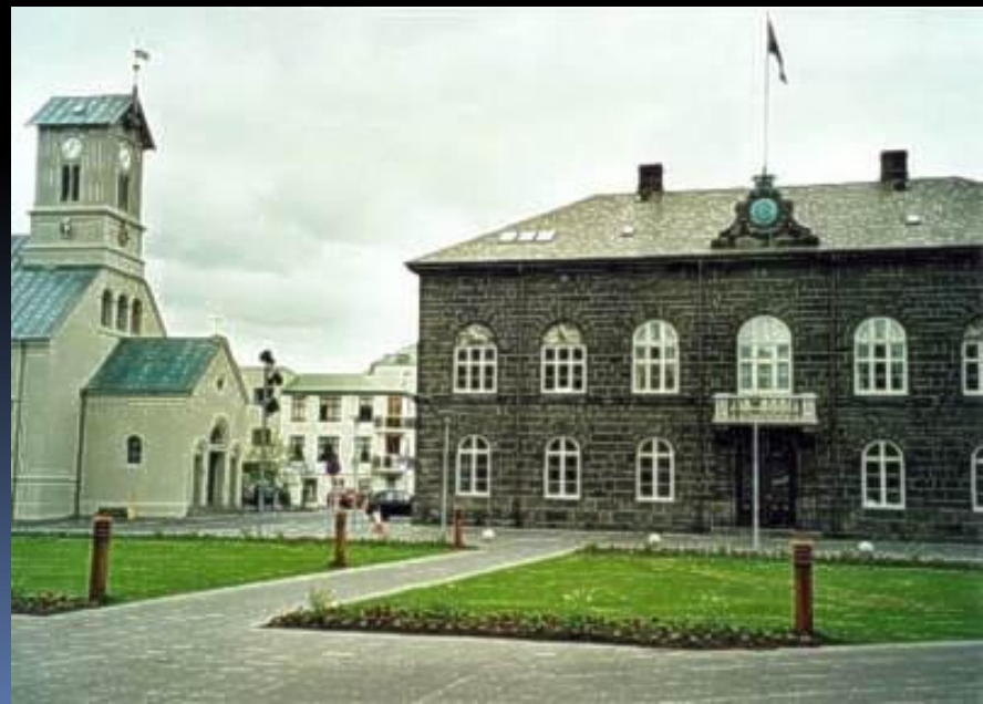
Рейкьявиктағы парламент ғимараты

Ал елдегі ең екпінді партия — «Тәуелсіздік партиясы». 2003 ж. соңғы алтинг депутаттары сайлауында аталмыш партия атынан «бәйгеге» түскен үміткерлер 22 орынды (33,7 %) жеңіп алған болатын. Исландиядағы өзге партиялар қатарында Прогрессивтік партия және социалистік-демократиялық альянс бар