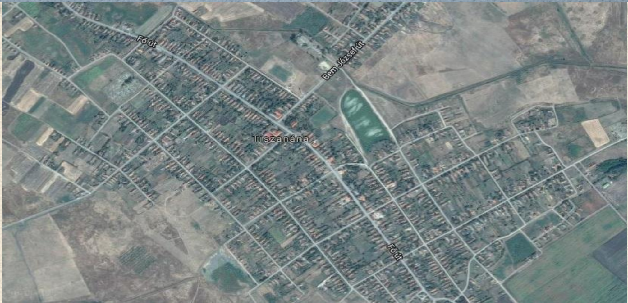
Tiszanána — Северная Венгрия. Население - 2474 человек «Хороший» посёлок