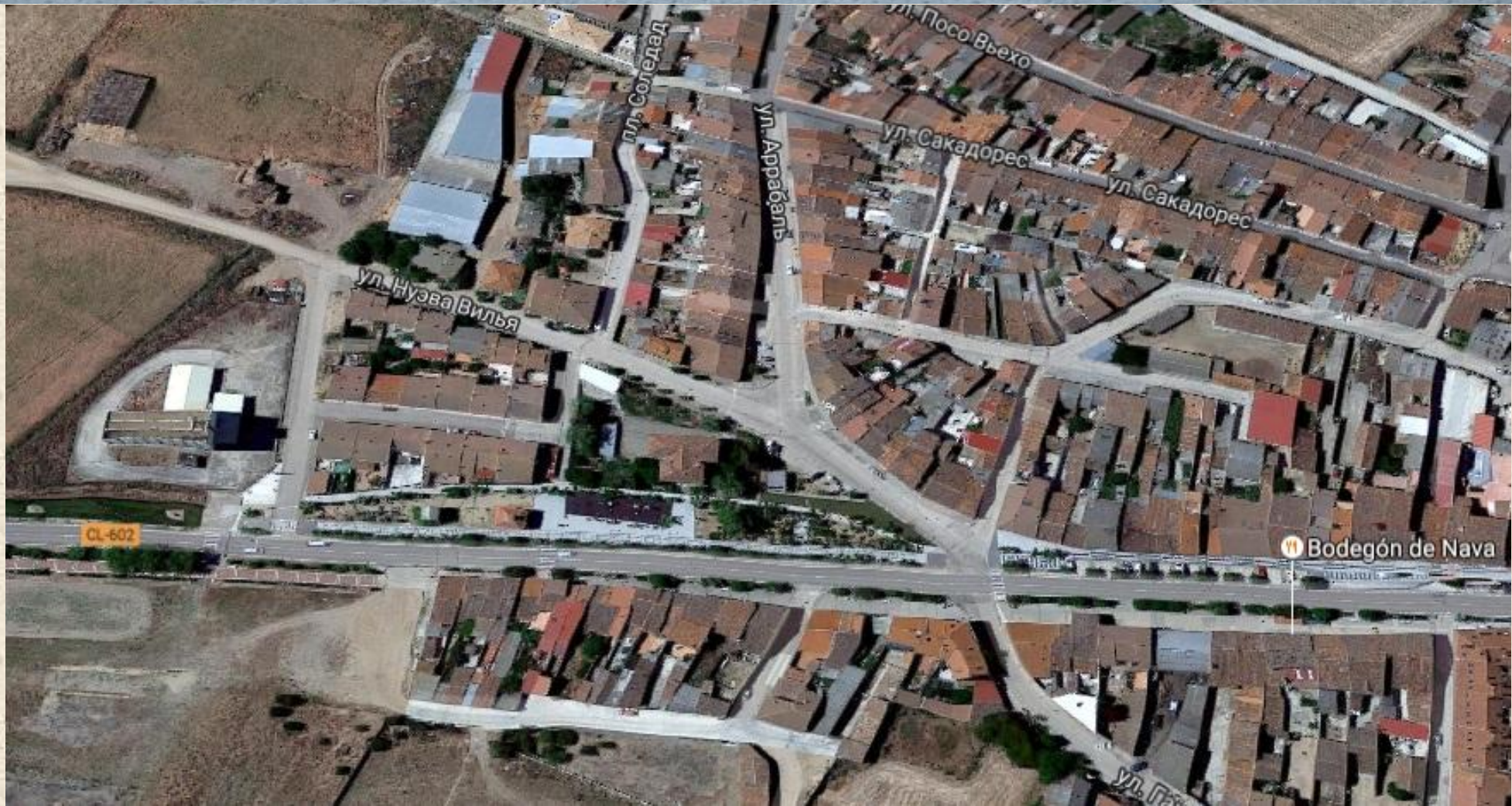
Нова-дель-Рей – Испания. Население – 2123 чел. «Плохой» посёлок.